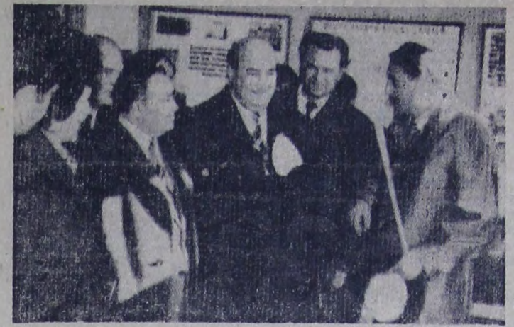
Делегация из города-побратима Триавы на балаковском заводе имени Дзержинского.