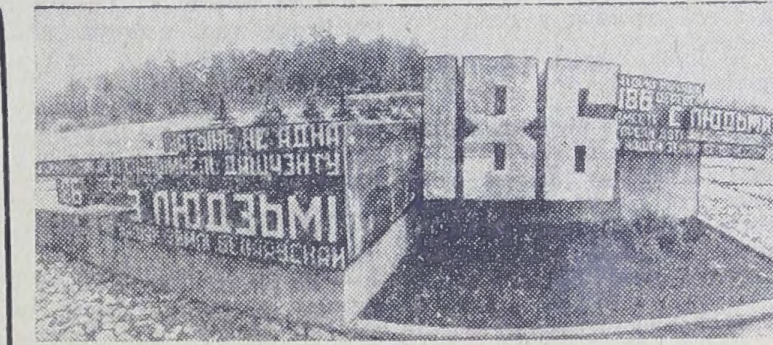
Белорусская деревня Хатынь была уничтожена фашистскими карателями весной 1943 года. Гитлеровцы заживо сожгли 149 жителей, из них 75 детей. В память о погибших на месте деревни сооружен мемориальный комплекс.