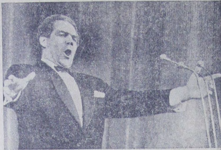
украинские народные песни. На снимке: поэт народный артист СССР Д. Гнатюк.

В Киевском государственном театре оперы и балета имени Т. Г. Шевченко певец создал незабываемые образы в оперных спектаклях «Гибель эскадры», «Тарас Бульба», «Наташка-Полтавка», «Никова дама», «Князь Игорь», «Кармен», «Риголетто». Дмитрий Гнатюк выступает и на эстраде, в его репертуаре