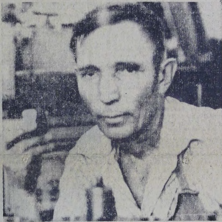
ХИМЗАВОД — УДАРНАЯ СТРОЙКА