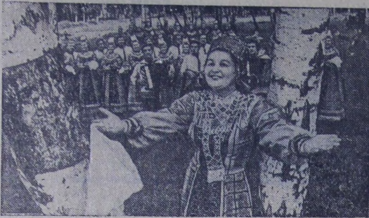
Государственный Воронежский русский народный хор известен в стране своими звонкими песнями и частушками, задорными плясками и хороводами.