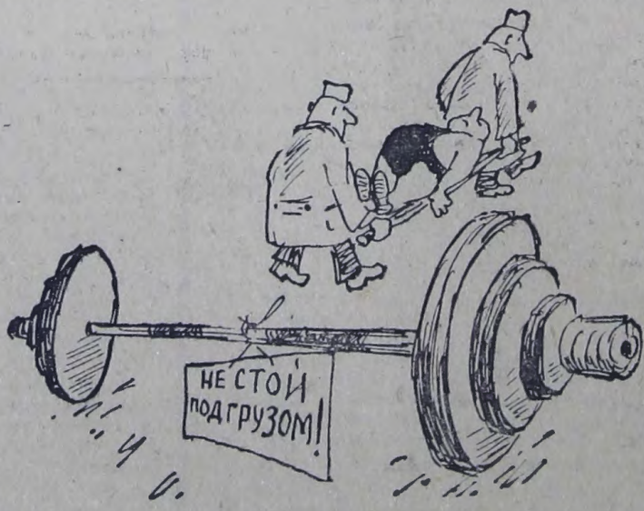
Рис. С. Ростова

1-2 октября. Вечера отдыха молодежи. (Танцплощадка. Начало в 21 час).