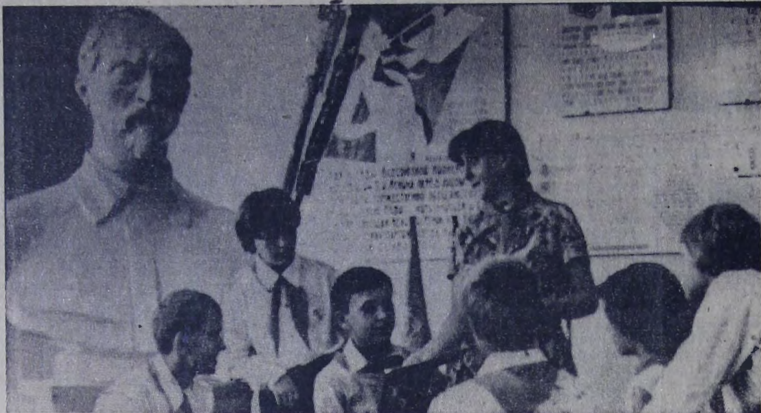
Большой любовью у пионеров и школьников школы № 4 пользуется музей Ф. Э. Дзержинского. Здесь ребята знакомятся с экспонатами, литературой, посвященной выдающемуся деятелю