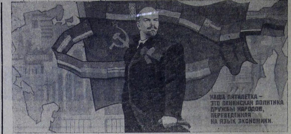
Плакат художника И. Комина. Издательство «Плакат».

Опыт свидетельствует, что участие трудовых коллективов и общественных организаций в составлении встречных планов является хорошей формой привлечения трудящихся к управлению производством, действенным методом повышения их трудовой и общественной активности. В связи с этим предлагаю статью 16