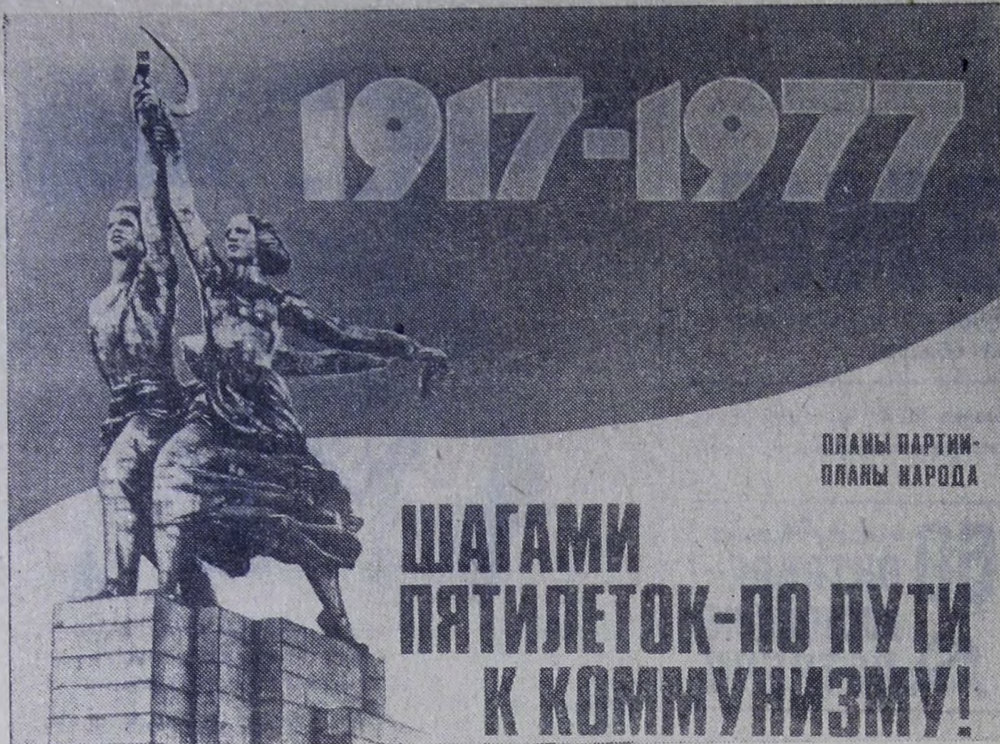
Плакат художников В. Прохорова, А. Мухиной, В. Евстифеева.