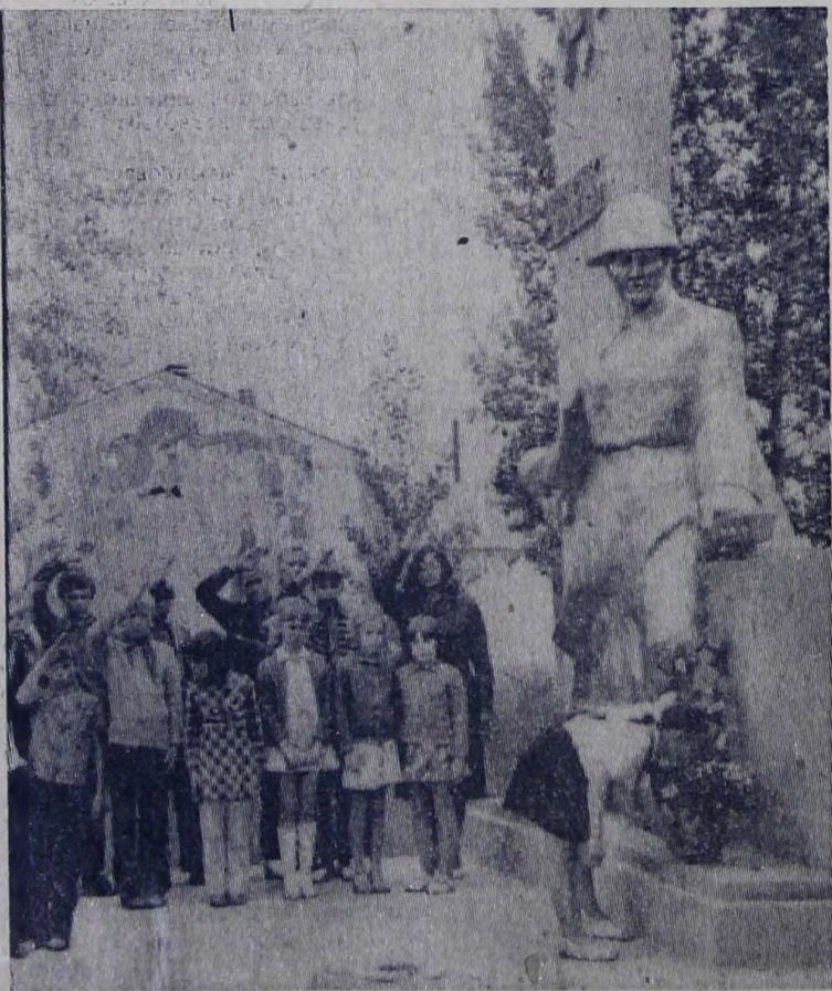
Редактор В. Д. ДЕЛАШИНСКИЙ