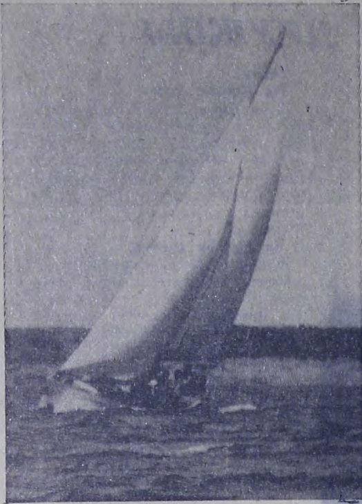
С ветром споря...