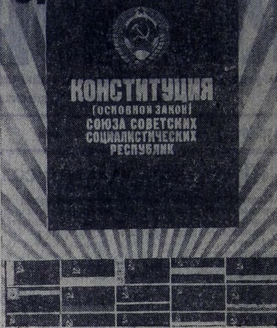
Плакат художника Ю. Кершина. Издательство «Плакат».