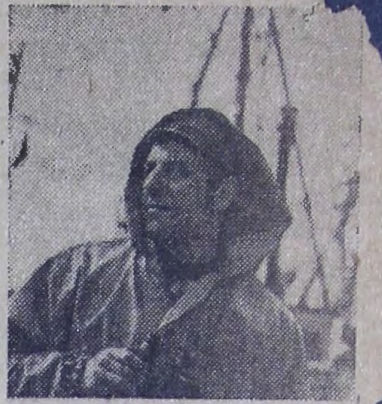
Латвийская ССР. Рыболовецкий колхоз «Узвара» («Победа»), расположенный в устье реки Лиелупе — один из передовых в Латвии.