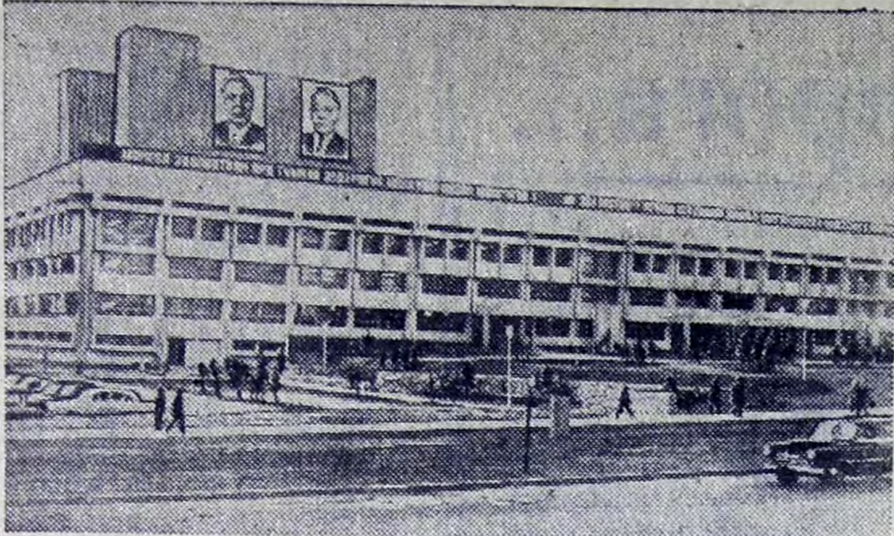
Советские строители треста № 2 Главмосстроя возводят в столице Монгольской Народной Респ. близи Улан-Баторе жилые дома, важные народнохозяйственные и культурно-бытовые объекты.