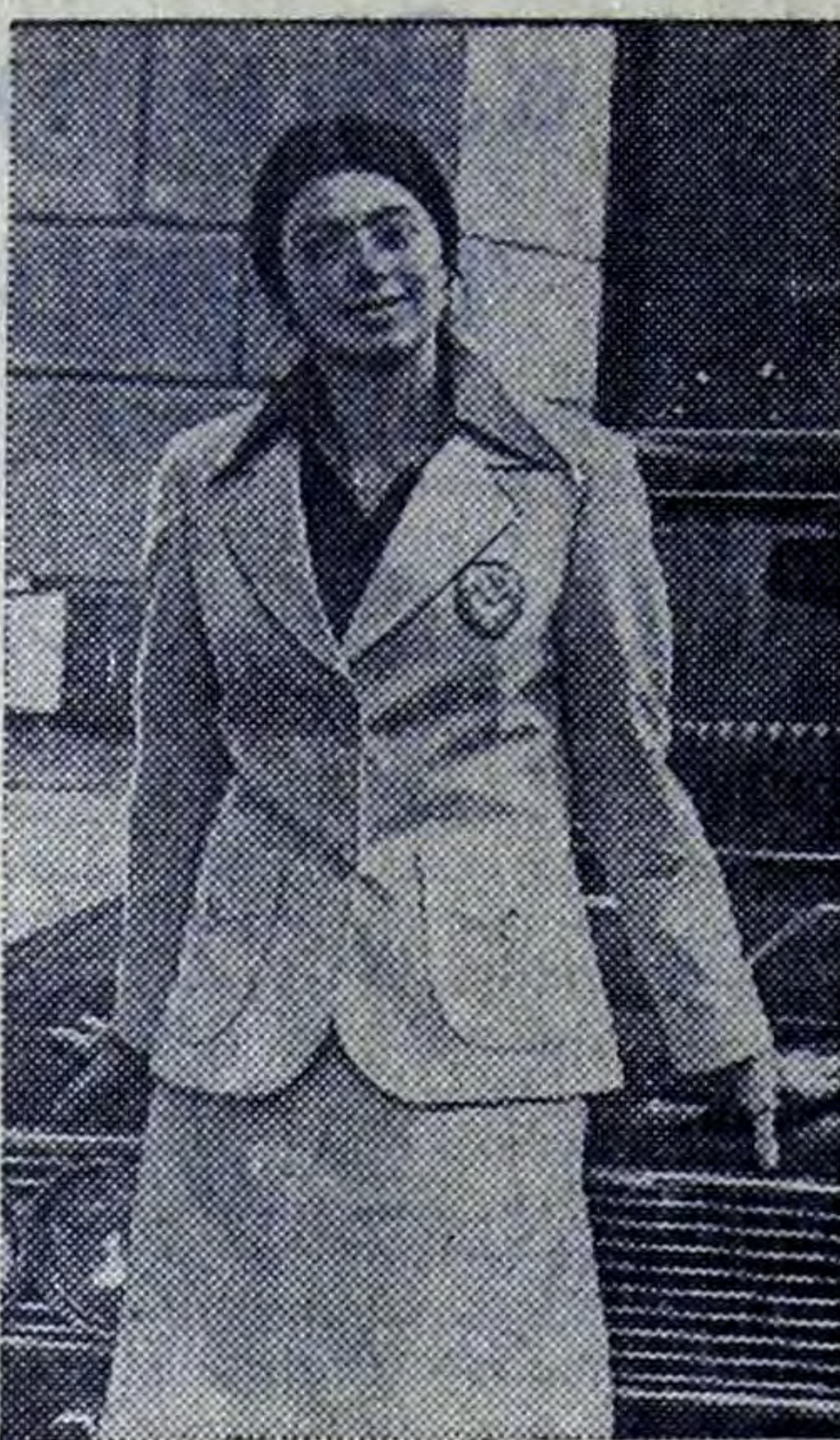
Москва. Так будет выглядеть парадная форма для советских олимпийцев. Ансамбль выполнен из льняной ткани светлого цвета. Рубашки хлопчатобумажные.