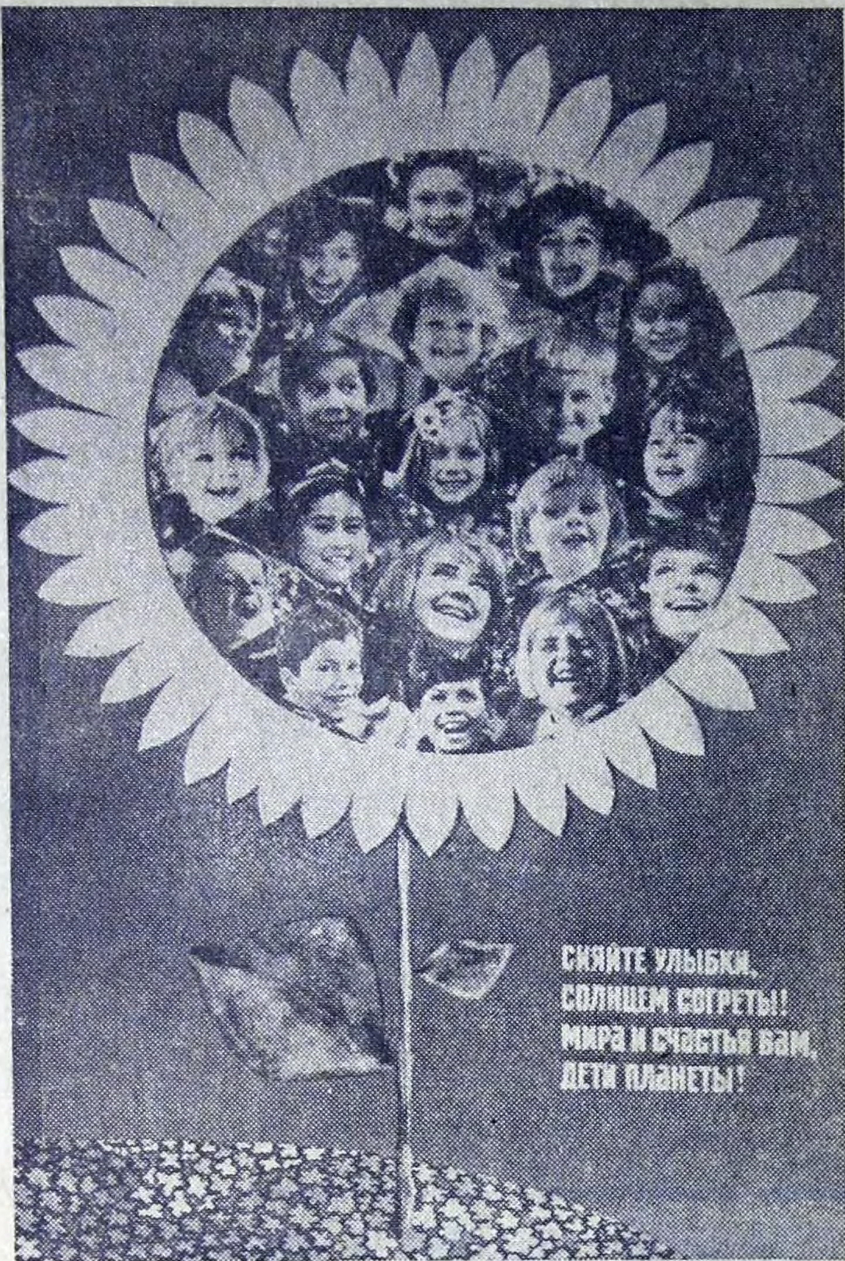
Плакат художника Б. Котляра.