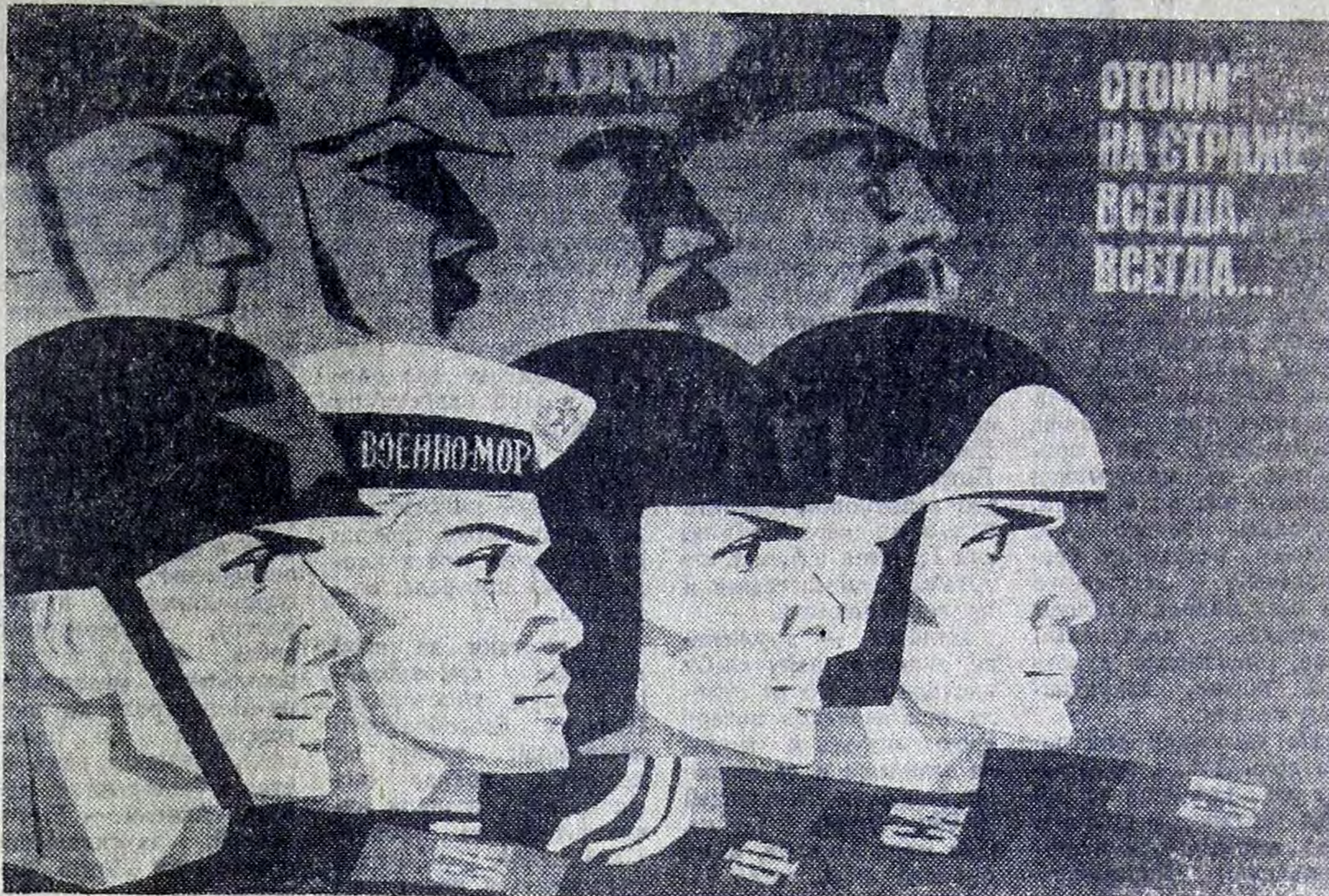
Плакат художника В. Кононова. Издательство «Плакат».