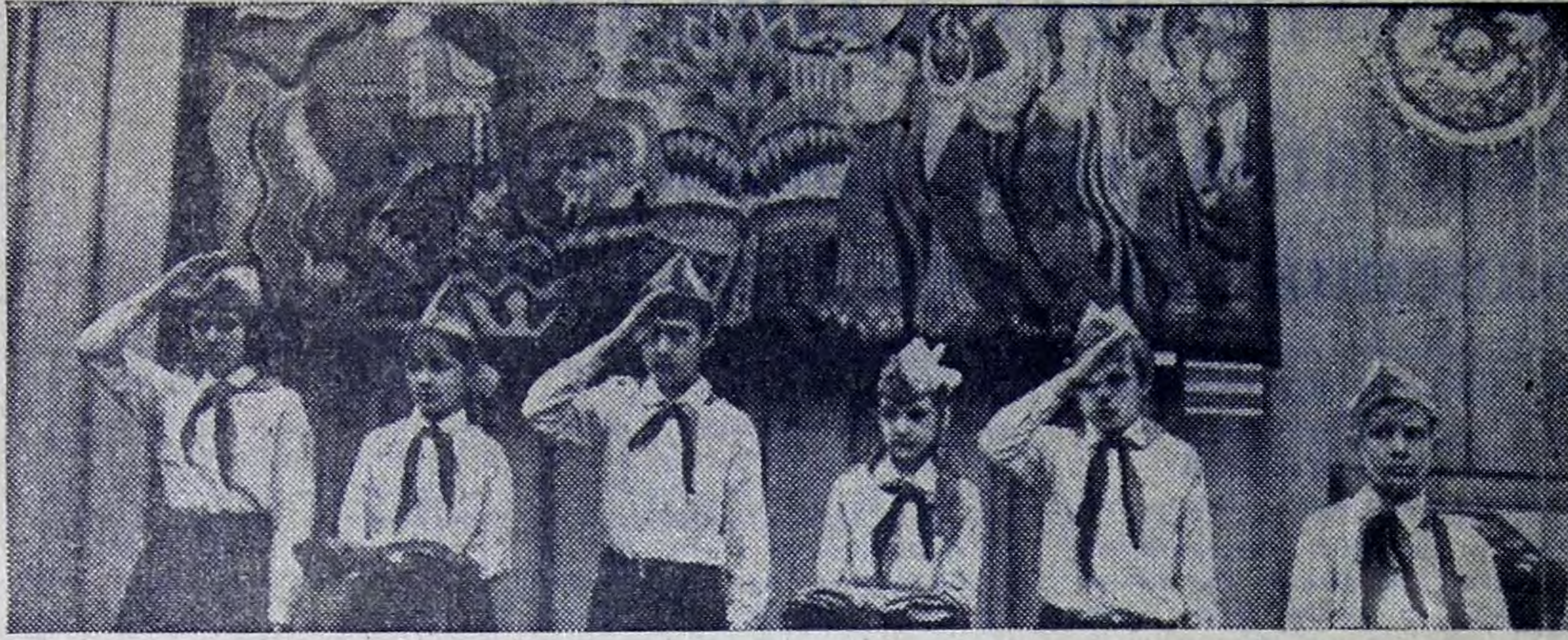
На снимке: прием в пионеры.