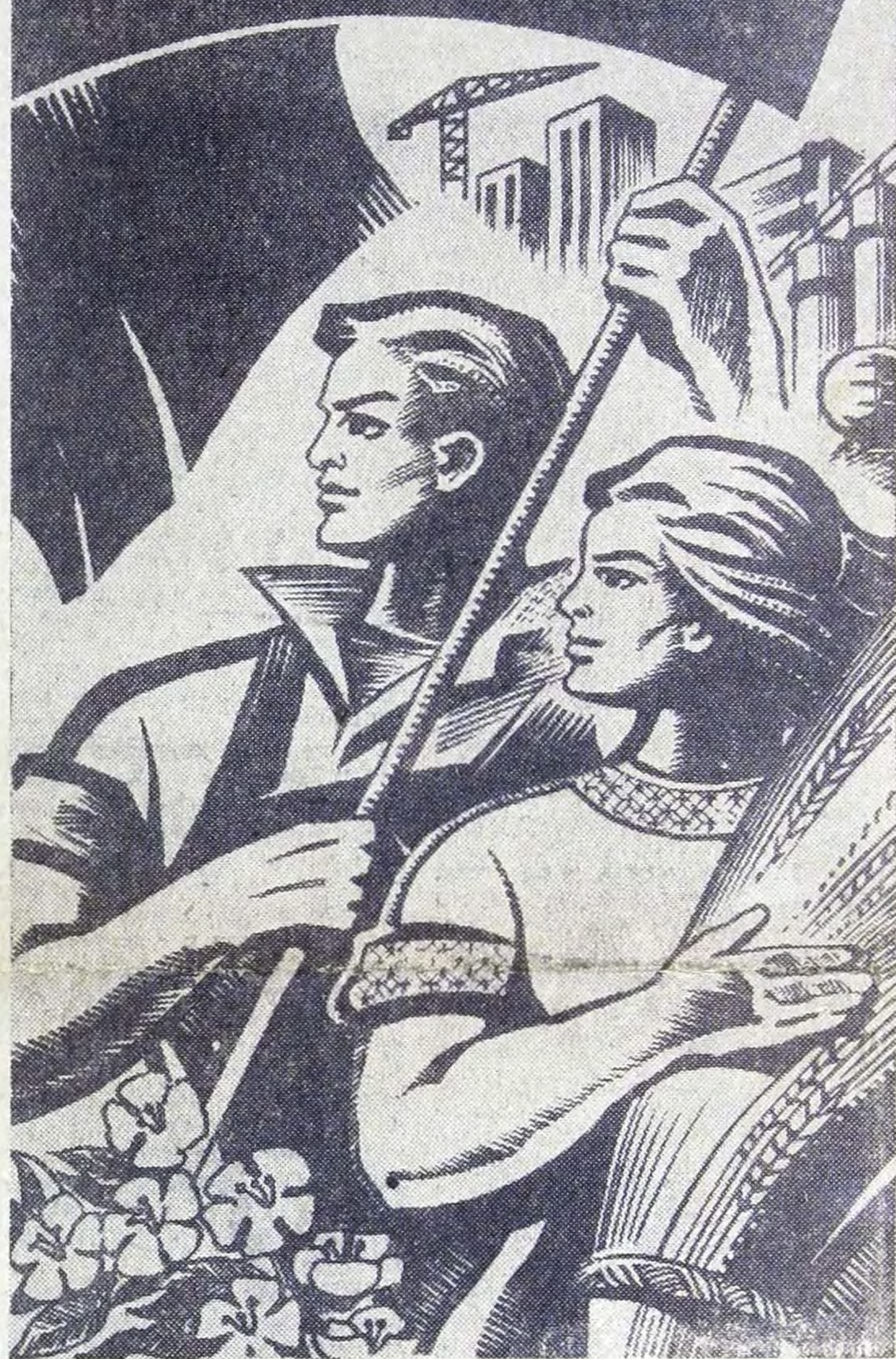
Плакат издательства «Московская правда».