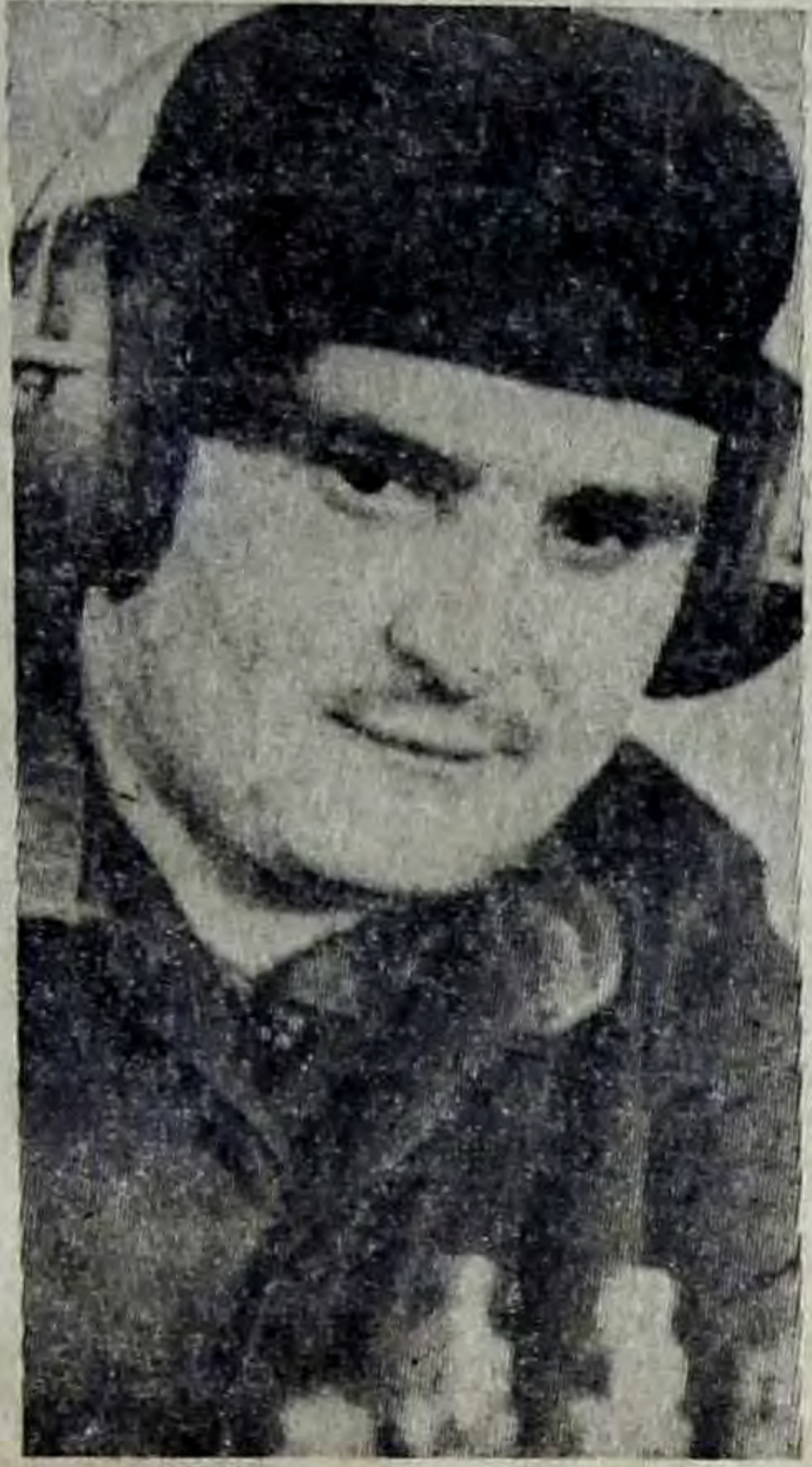
ОНИ ИДУТ ВПЕРЕДИ

№ 67 (8155) ♦ Вторник, 27 апреля 1976 года ♦ Год издания 59-й ♦ Цена 2 коп.