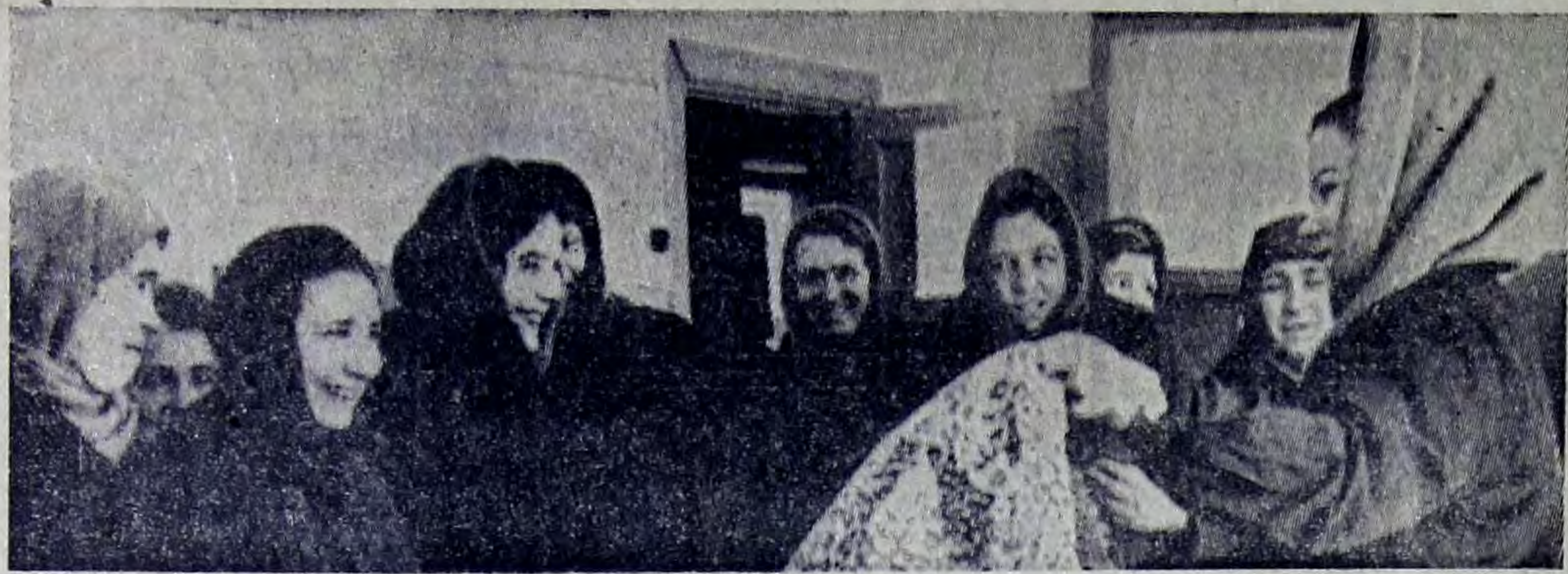
Правление райпо широко практикует выездную торговлю товарами в колхозах и совхозах района, стараясь полней удовлетворить потребности сельских тружеников.