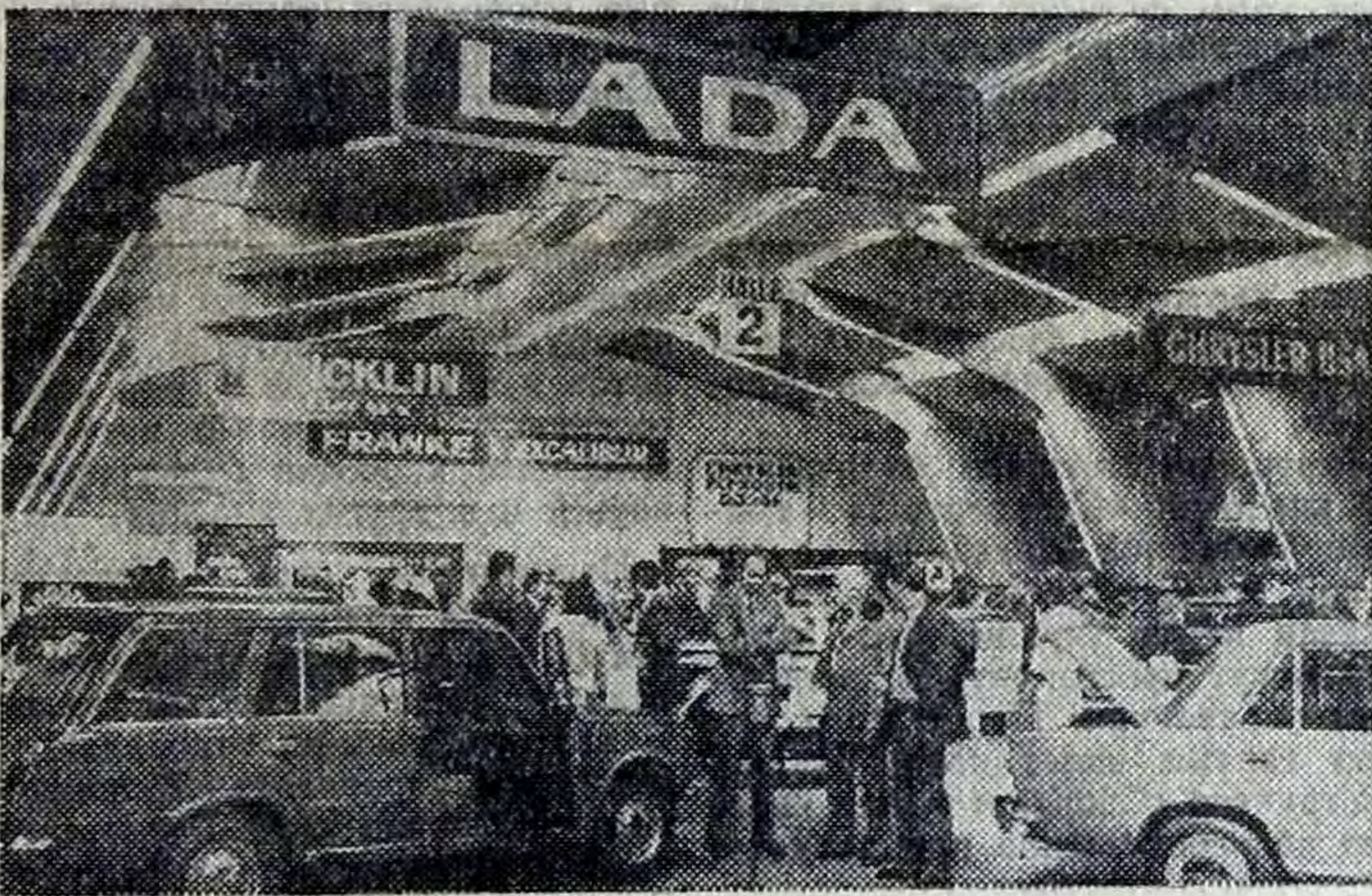
Швейцария. Автомобили Волжского автозавода «Лада» («Жигули») пользуются большим успехом на 46-м Женевском автосалоне, где демонстрируют свою продукцию 86 крупнейших автомобильных фирм из 26 стран мира.