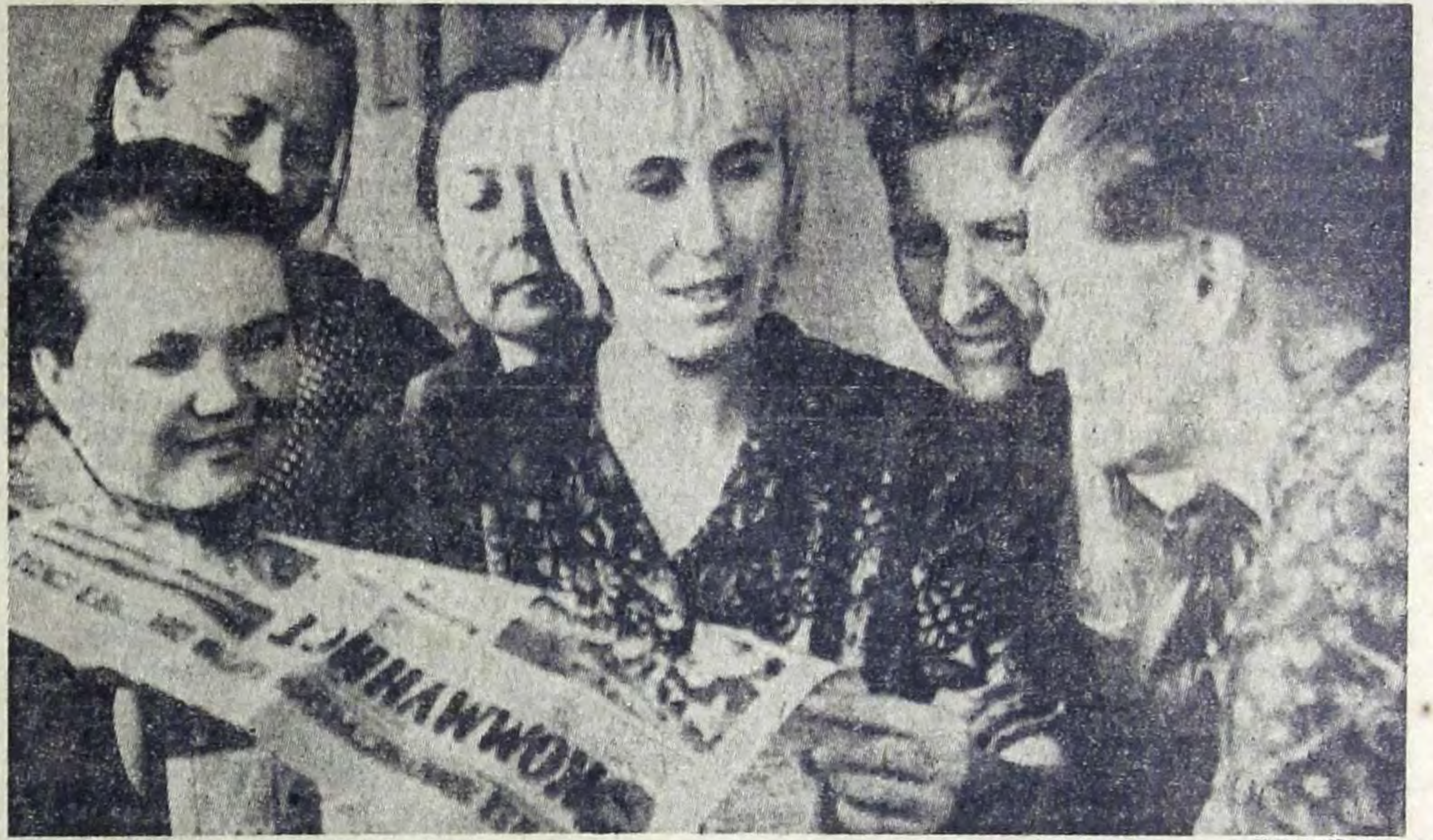
С большим интересом животноводы колхоза «Знамя коммунизма» изучают решения XXV съезда КПСС. На животноводческих фермах, в механической мастерской агитаторы всегда желанные гости.

Этот слет должен стать важной вехой на пути активизации работы народных дружин, участия широких слоев общественности города в благородном деле борьбы за укрепление социалистического правопорядка.