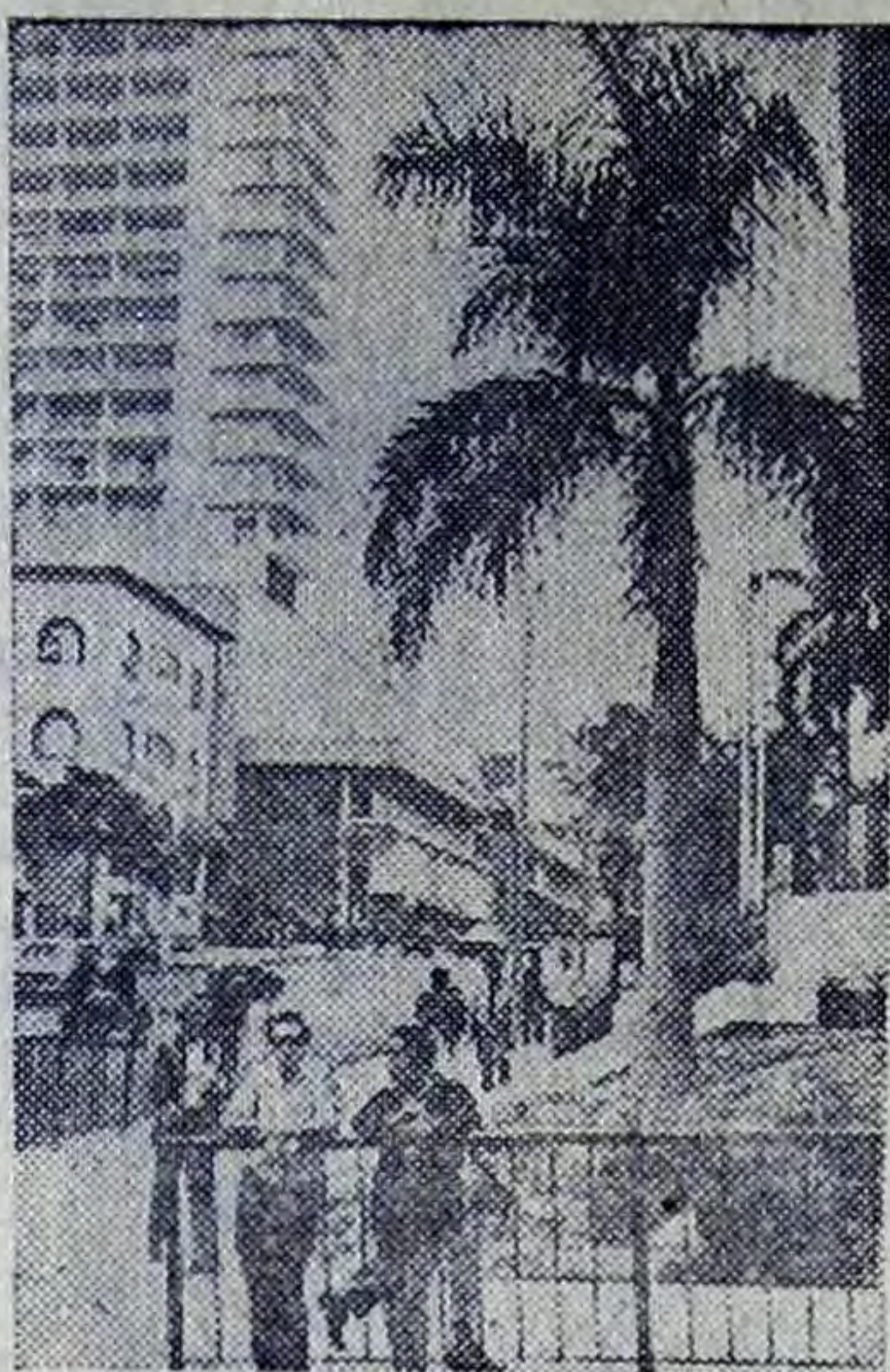
На снимке: на улице в Гаване.