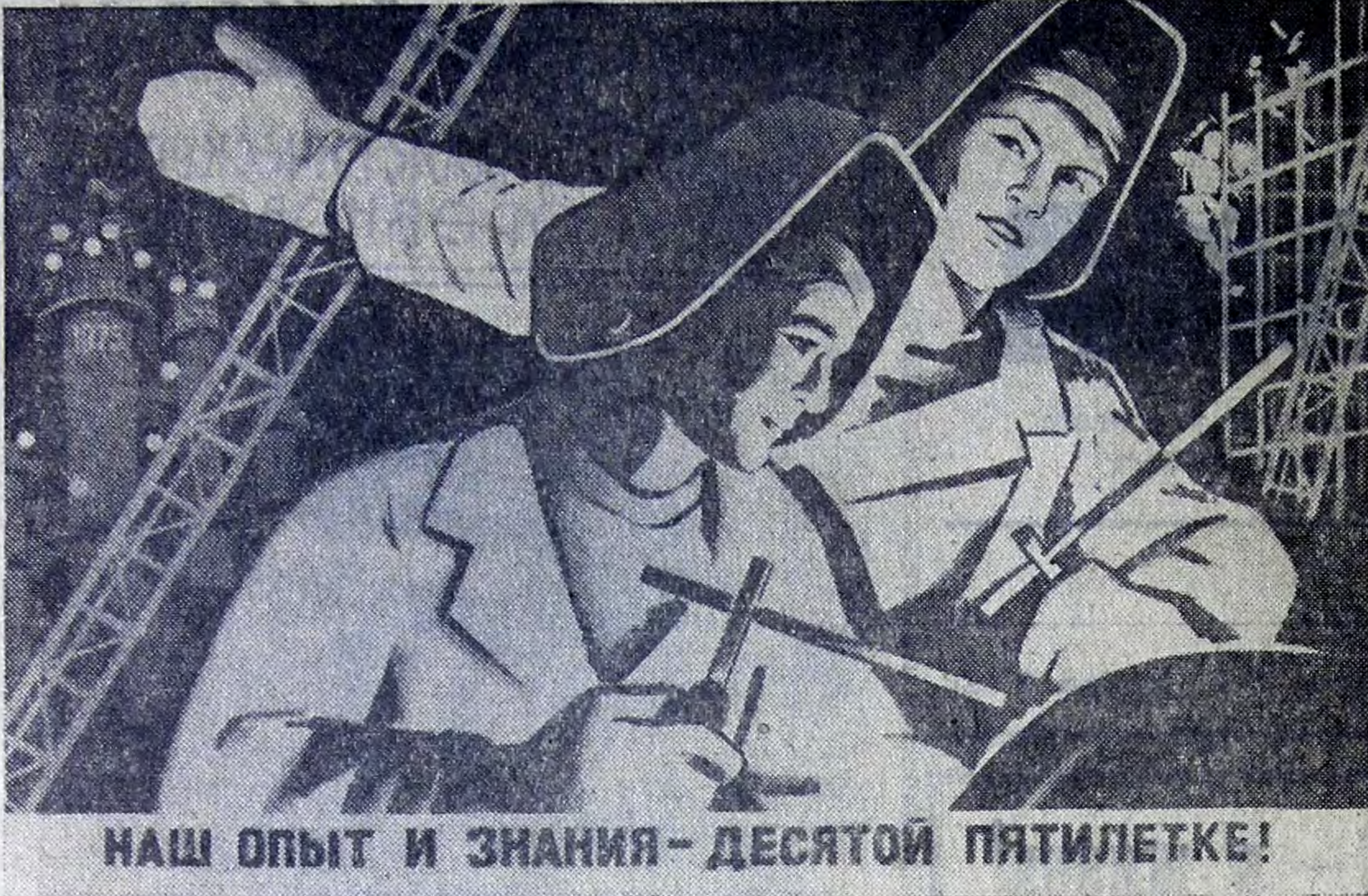
НАШ ОПЫТ И ЗНАНИЯ — ДЕСЯТОЙ ПЯТИЛЕТКЕ!

Плакат художника Л. Голованова. Издательство «Плакат»