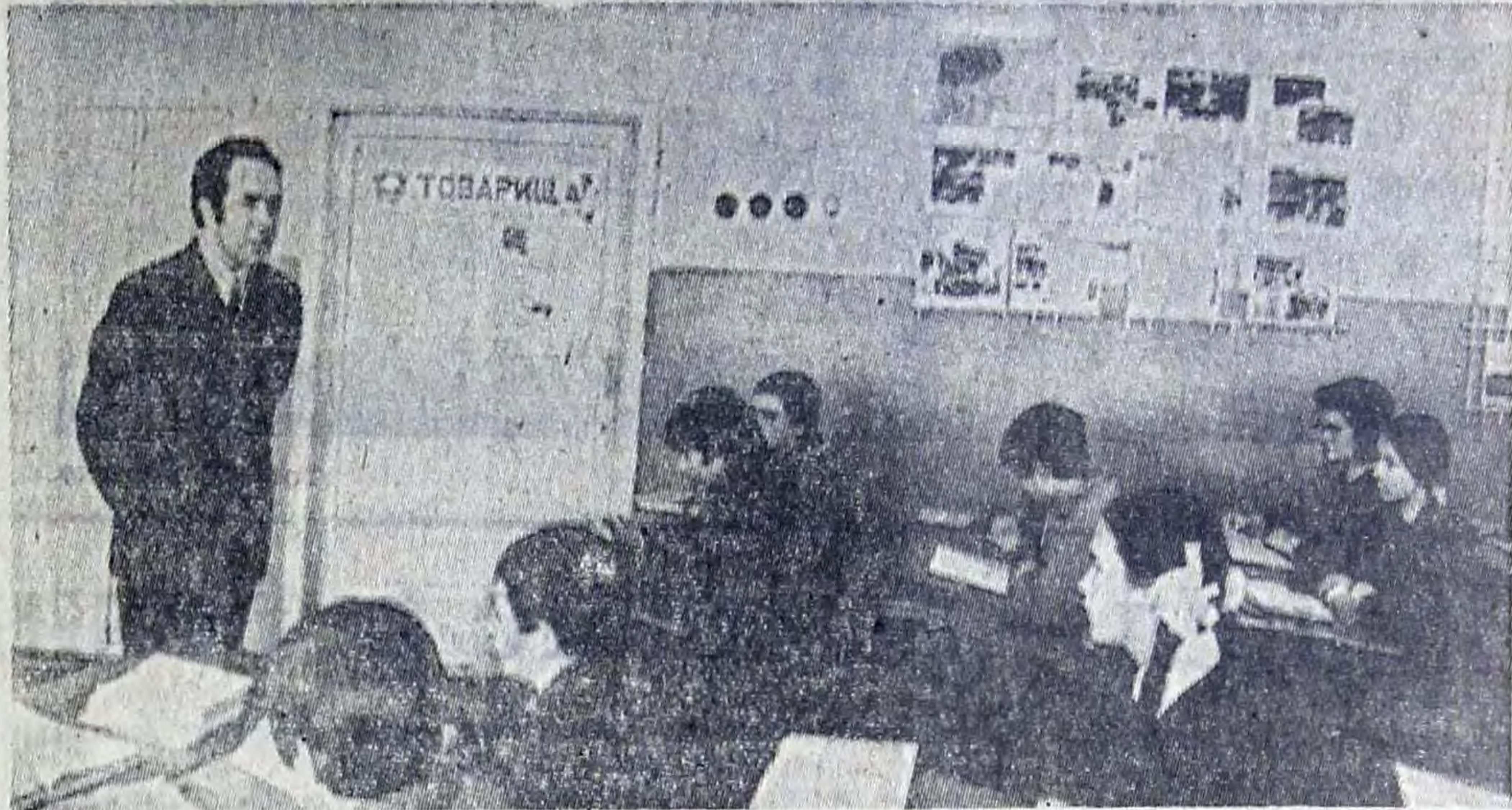
★ БОЛЬШЕ ВНИМАНИЯ ПОДРОСТКАМ