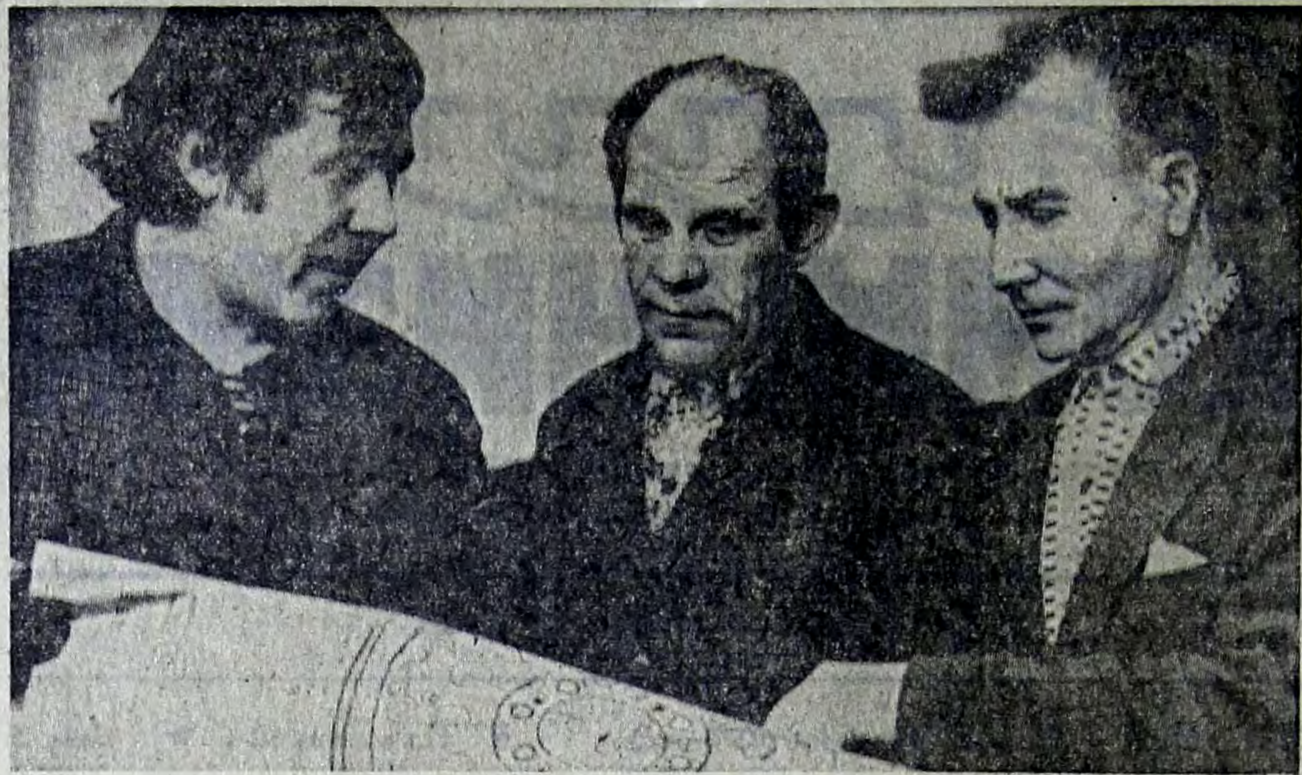
В числе коллективов цехов и участков завода им. Дзержинского, добившихся наилучших результатов в борьбе за достойную встречу XXV съезда КПСС и завоевавших право называться «Коллектив им. XXV съезда КПСС», достойное место занимает бригада разметчиков цеха дизелей.