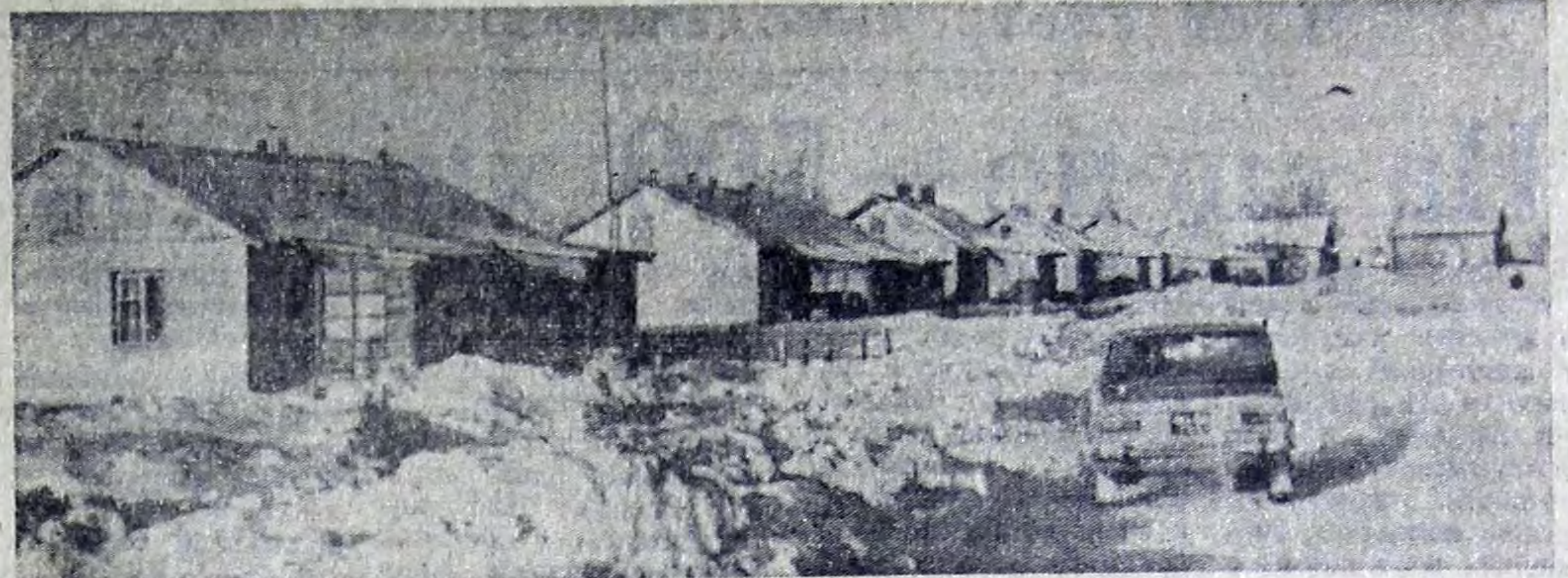
Помимо строительства производственных и культурно-бытовых зданий в колхозе им. Чкалова возводятся и жилые дома. За истекшее пятилетие в хозяйстве было построено 10 жилых домов с полезной площадью в 812 квадратных метров.