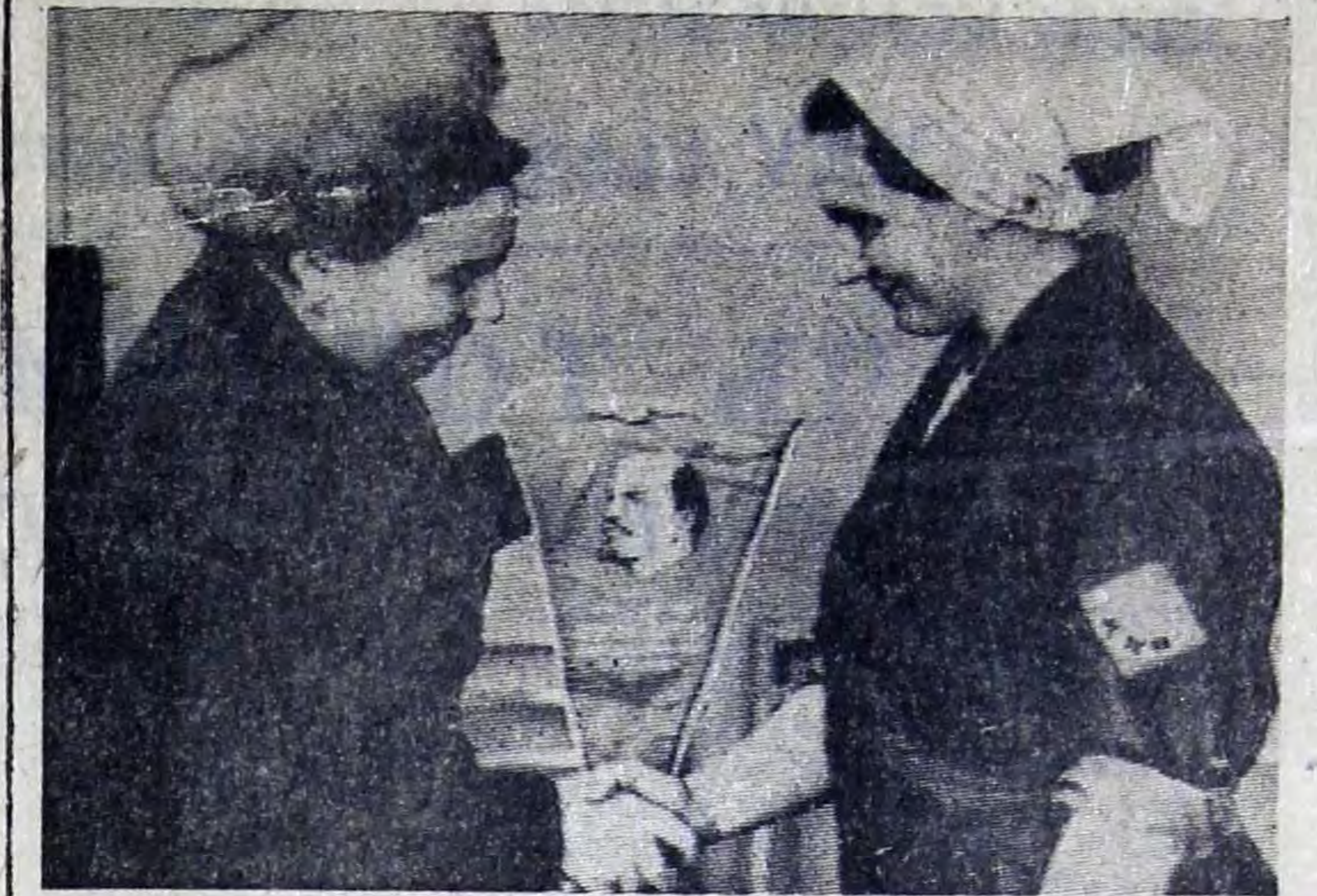
ОНИ ИДУТ ВПЕРЕДИ

Товарищи! В откликах международной печати на наш съезд, в том числе и печати буржуазной, отмечаются сплоченность и оптимизм советских коммунистов, миролюбие, стабильность и уверенный характер политики Коммунистической партии Советского Союза. Я думаю, мы с вами мо-