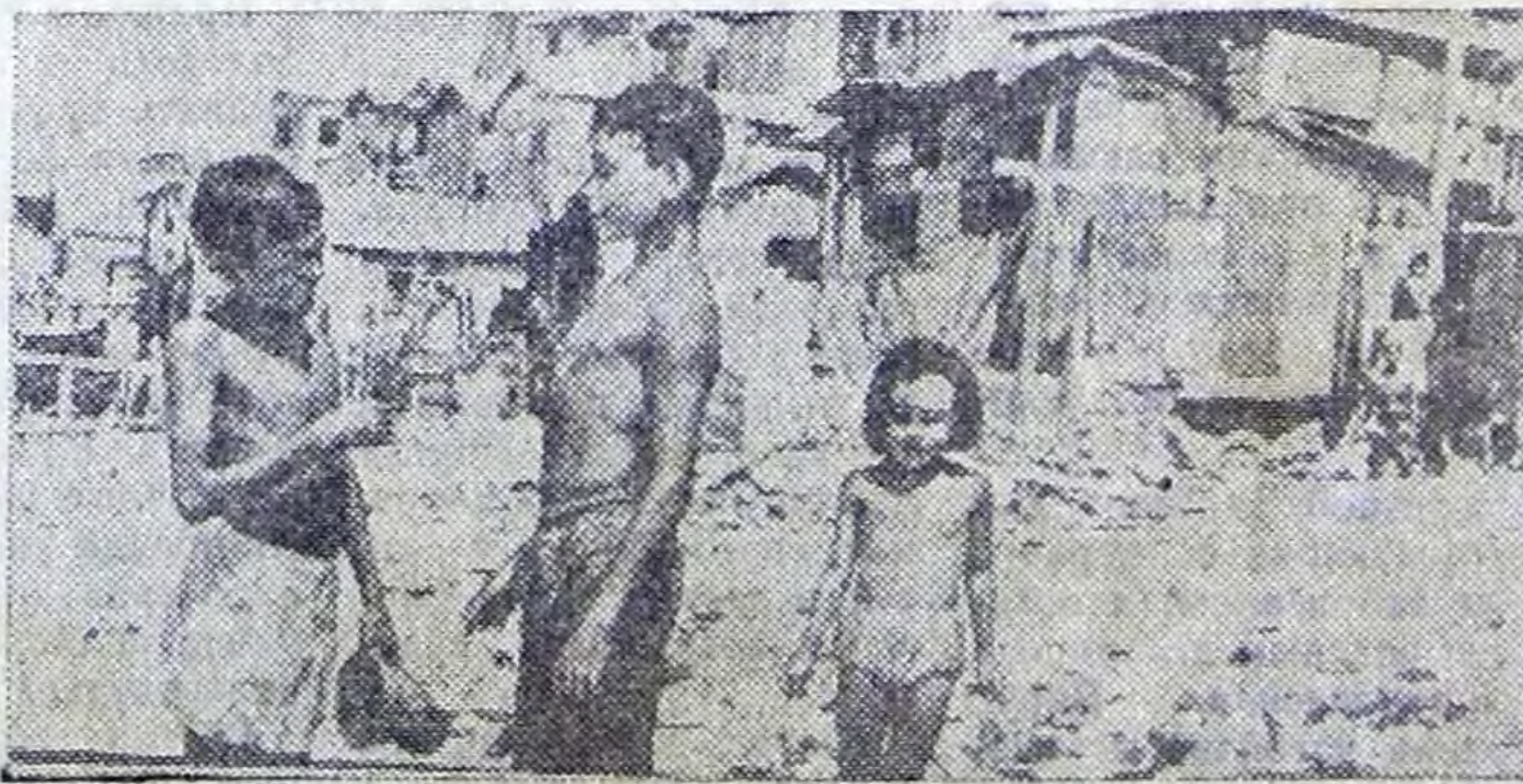
В условиях нищеты, безработицы и дороговизны живет население Пуэрто-Рико, небольшой страны в Карибском море, имеющей статус присоединившегося к США государства.