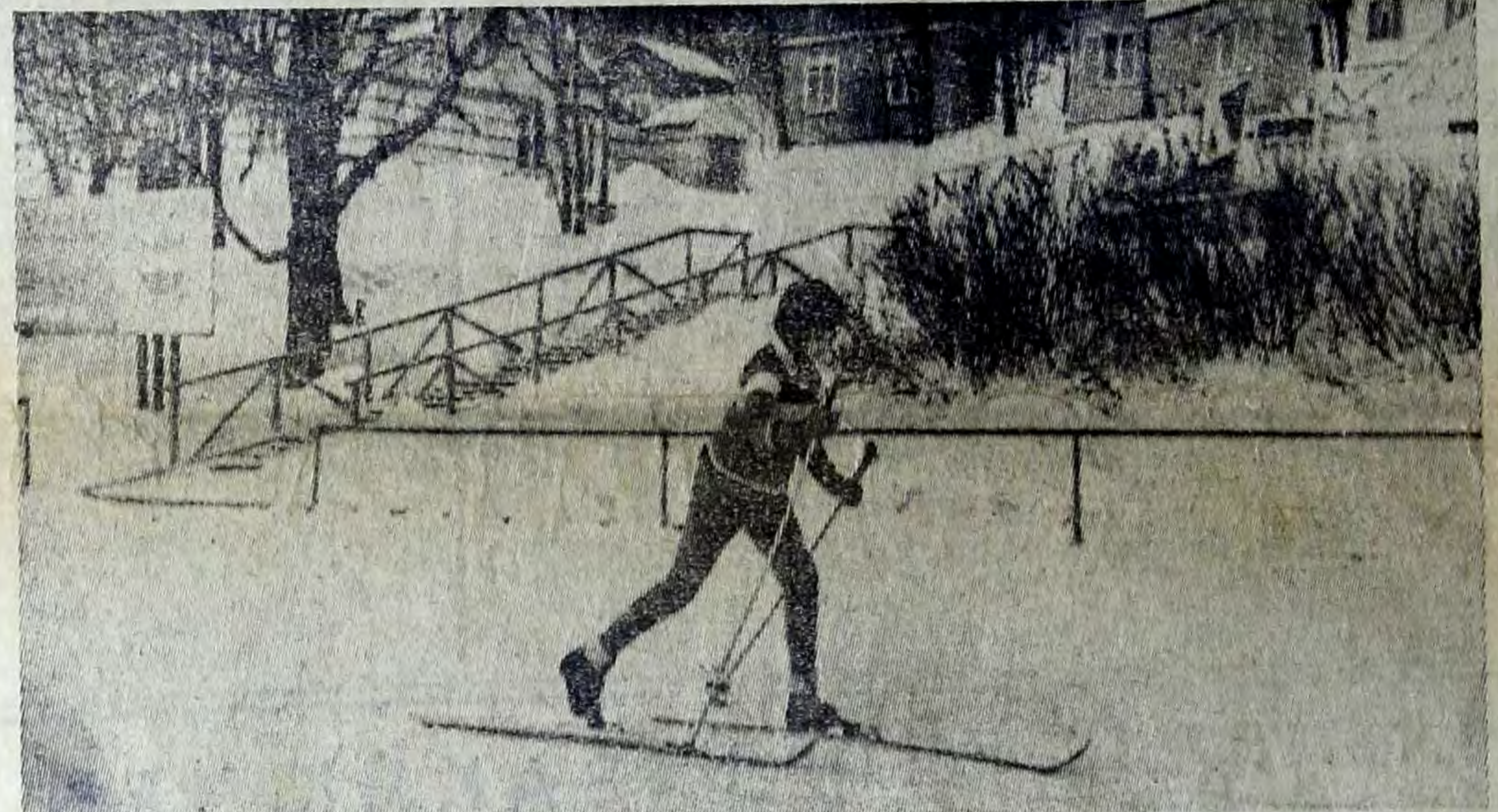
НА ЛЫЖНОЙ БАЗЕ СПОРТКЛУБА «КОРД»