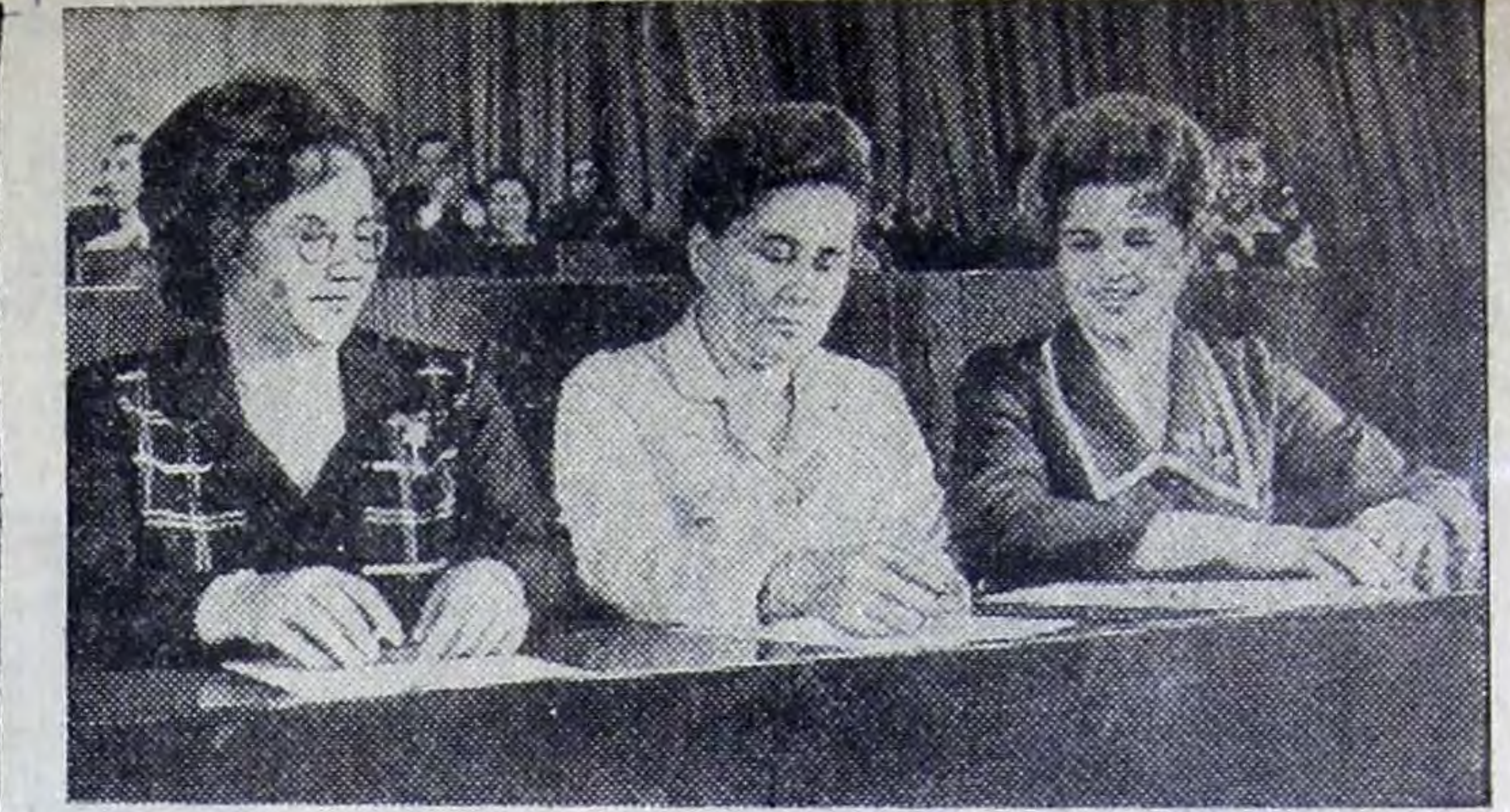
Участники проходившего в Иваново Всесоюзного слета передовиков производства легкой промышленности, выполнивших в девятой пятилетке по два личных пятилетних задания, решили в новой пятилетке продолжить трудовое соперничество. Передовые текстильщицы, швеи, обувщицы заключили между собой договор на социалистическое соревнование за достижение в десятой пятилетке наивысшей производительности труда и отличного качества выпускаемой продукции. На снимке: лучшие ткачихи

На основе повышения эффективности и качества работы в орошаемом земледелии обеспечить получение с гектара: зерна 35 центнеров, кукурузы на силос — 350 — 370, зеленой массы многолетних трав — 400 — 450 центнеров. Урожайность овощей довести до 250, картофеля — до