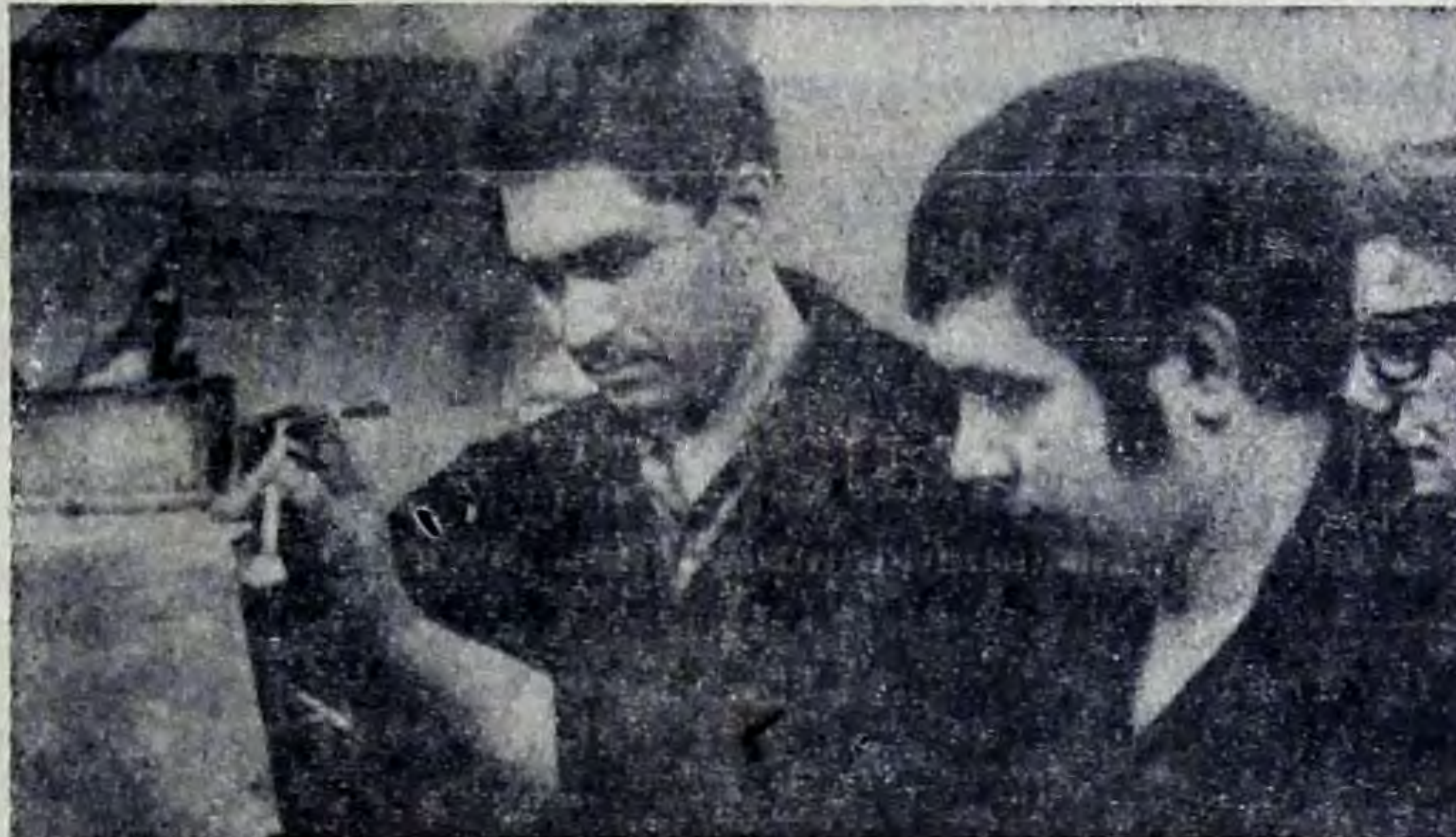
В экспериментальном участке механо-сборочного цеха завода запасных деталей коллективом рационализаторов изготовлен стенд для испытания капровых насосов, играющих важную роль на предприятиях химической промышленности.