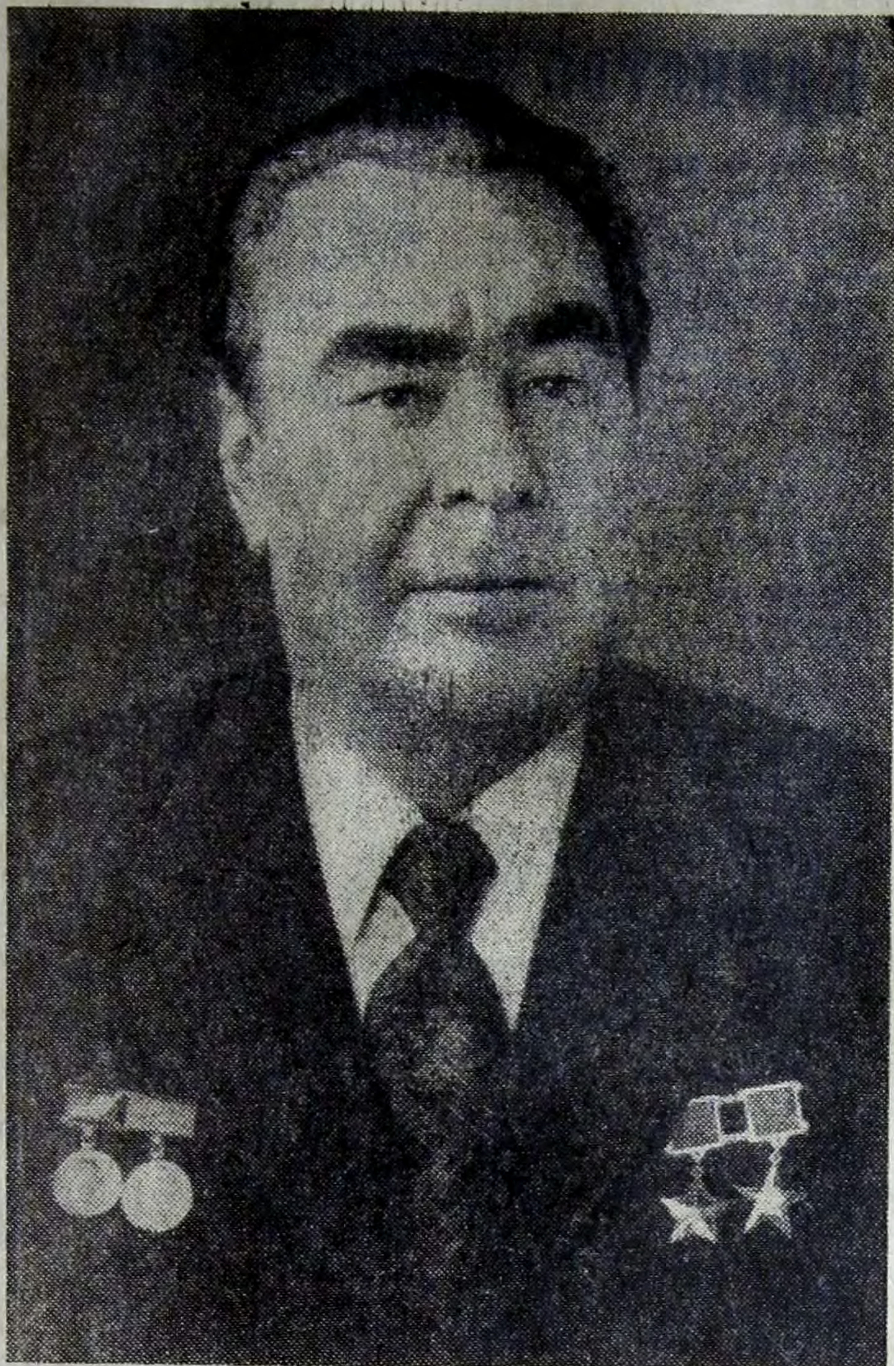
Завтра Генеральному секретарю ЦК КПСС товарищу Леониду Ильичу Брежневу исполняется 70 лет.

№ 202 (8290) ♦ Суббота, 18 декабря 1976 года ♦ Год издания 59-й ♦ Цена 2 коп.