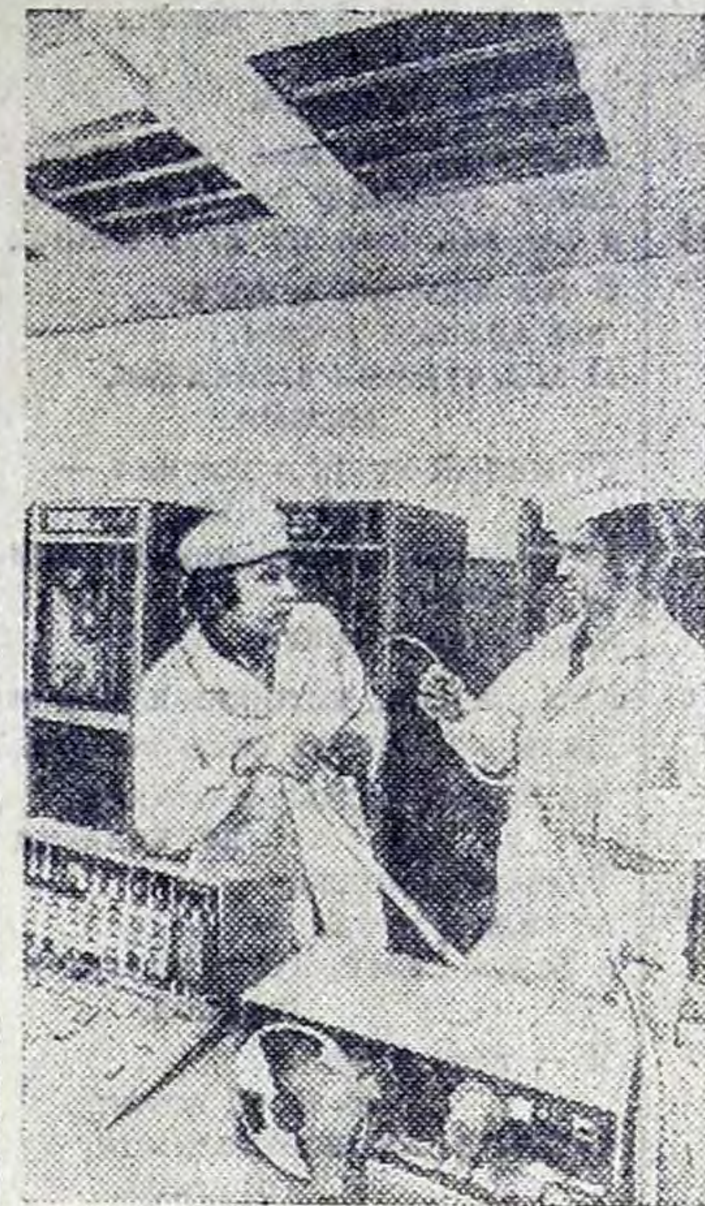
На верхнем снимке: турбинный зал Курской АЭС.