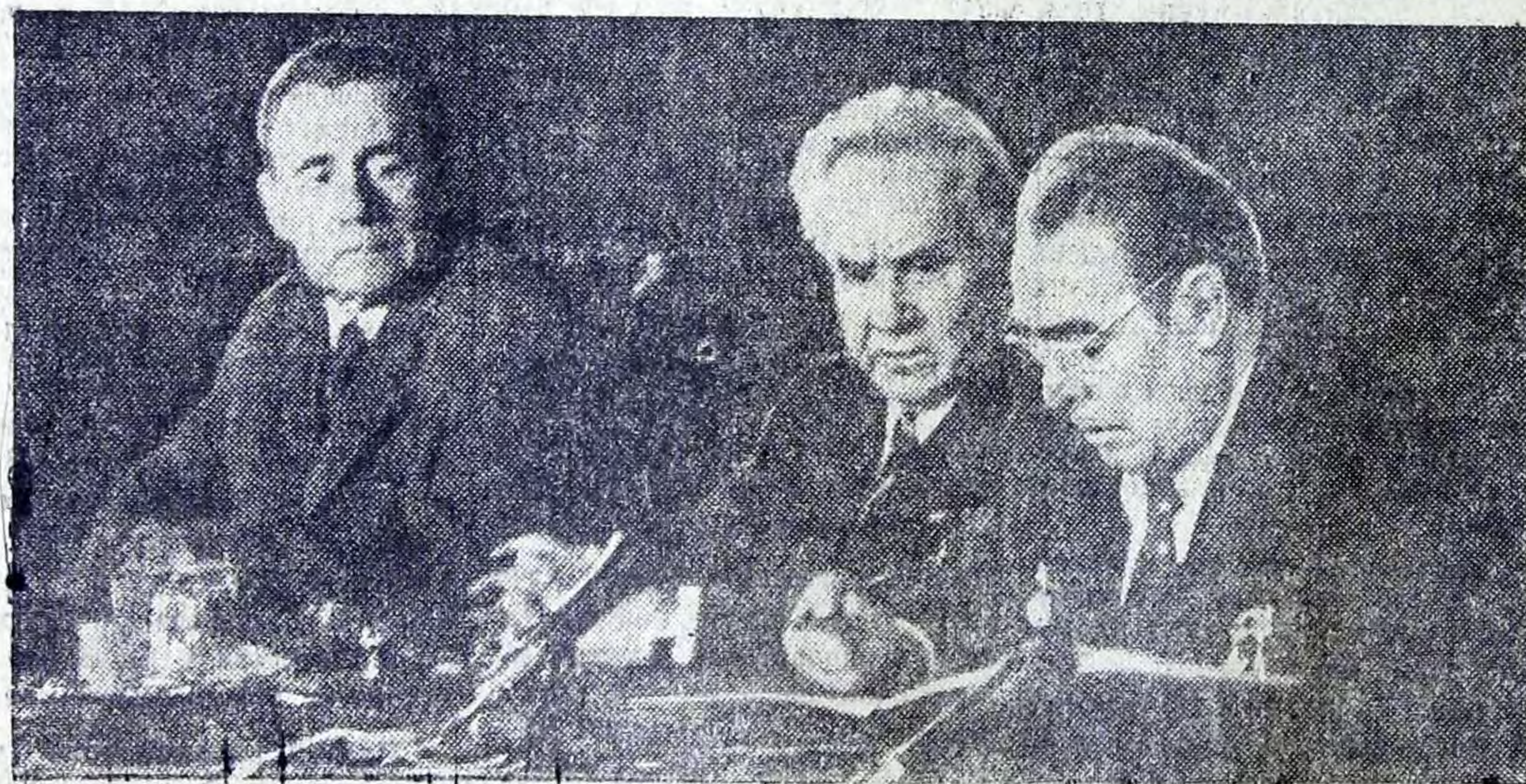
Бухарест. Ноябрь 1976 года. Подписание Декларации государств — участников Варшавского Договора Генеральным секретарем ЦК КПСС товарищем Л. И. Брежневым.