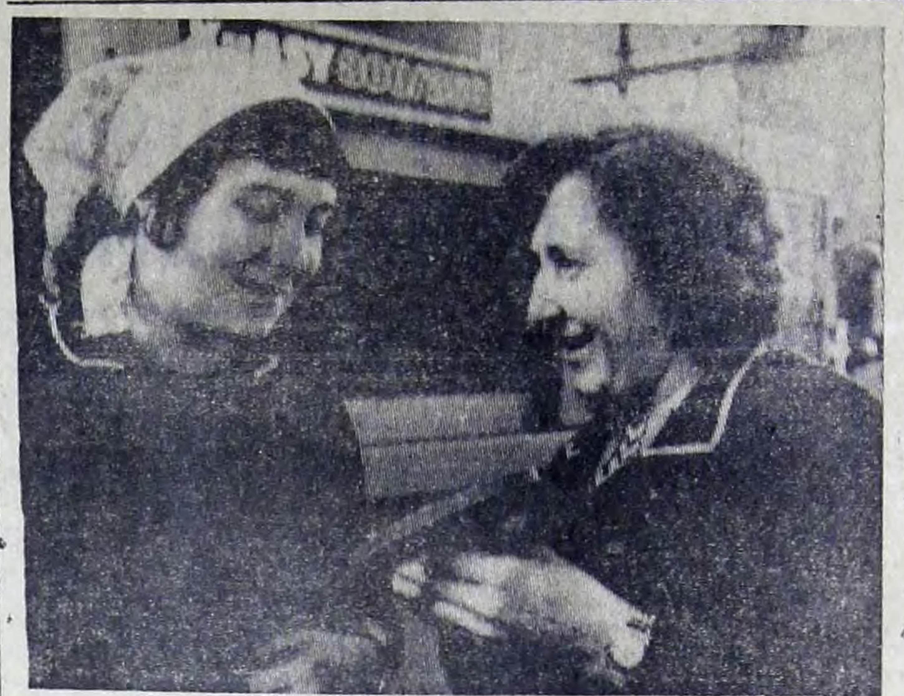
ОНИ ИДУТ ВПЕРЕДИ

№ 165 (8253) ♦ Пятница, 15 октября 1976 года ◀ Год издания 59-й ♦ Цена 2 коп.