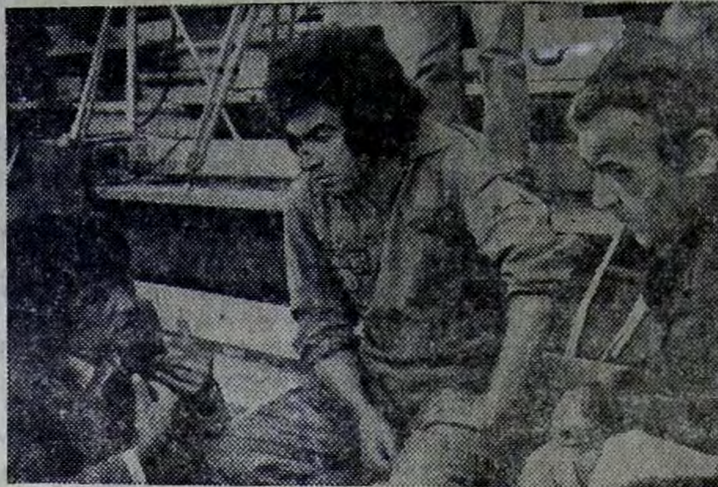
Москва. На киностудии «Мосфильм» советские и чилийские кинематографисты ведут съемки художественного фильма «Ночь над Андами». Он расскажет о трагедии чилийского народа, находившегося под игом военной хунты.

А соль... Цена известна ей: она не дорога!