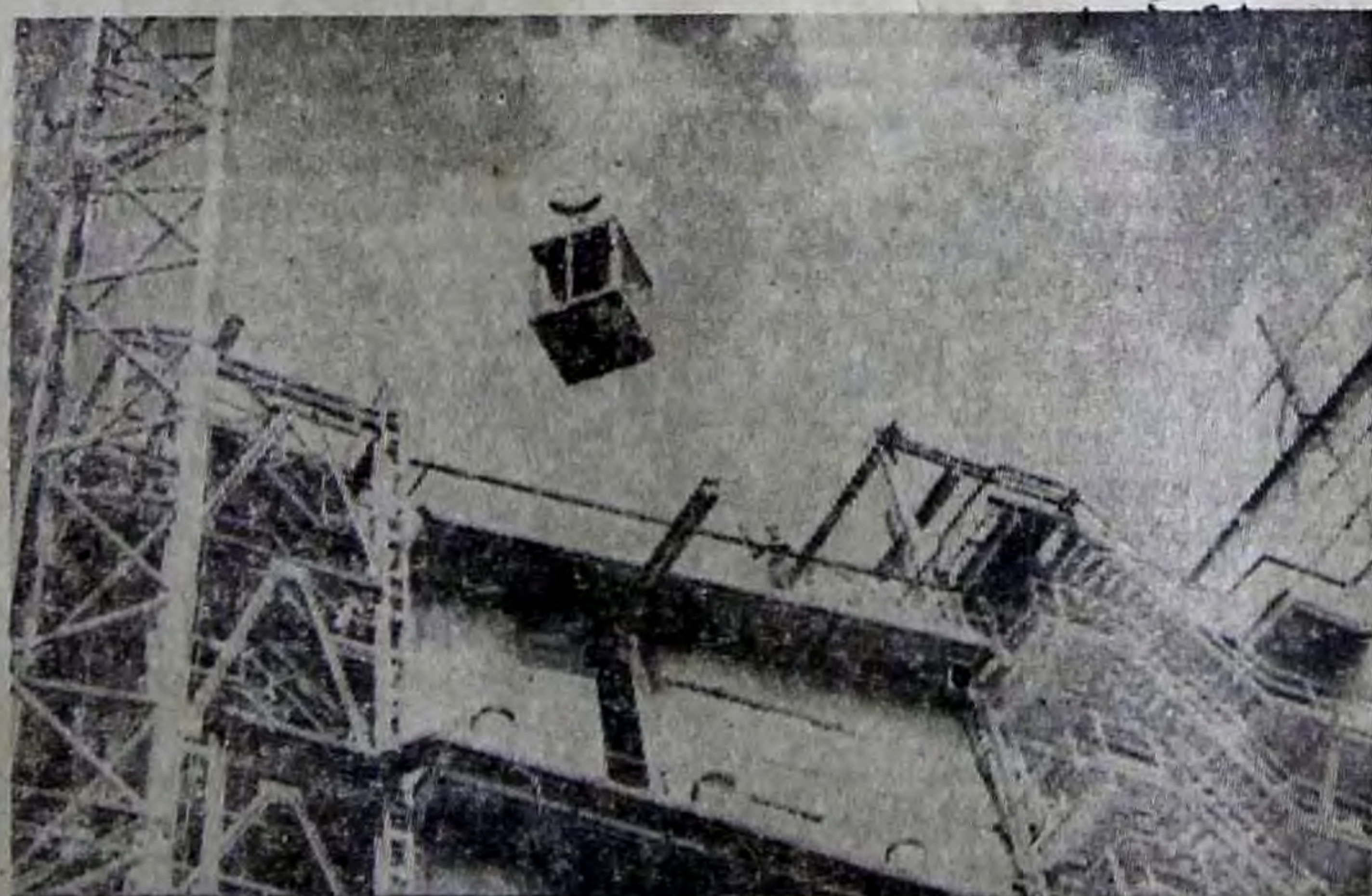
На строительстве печного отделения третьего сернокислотного производства.