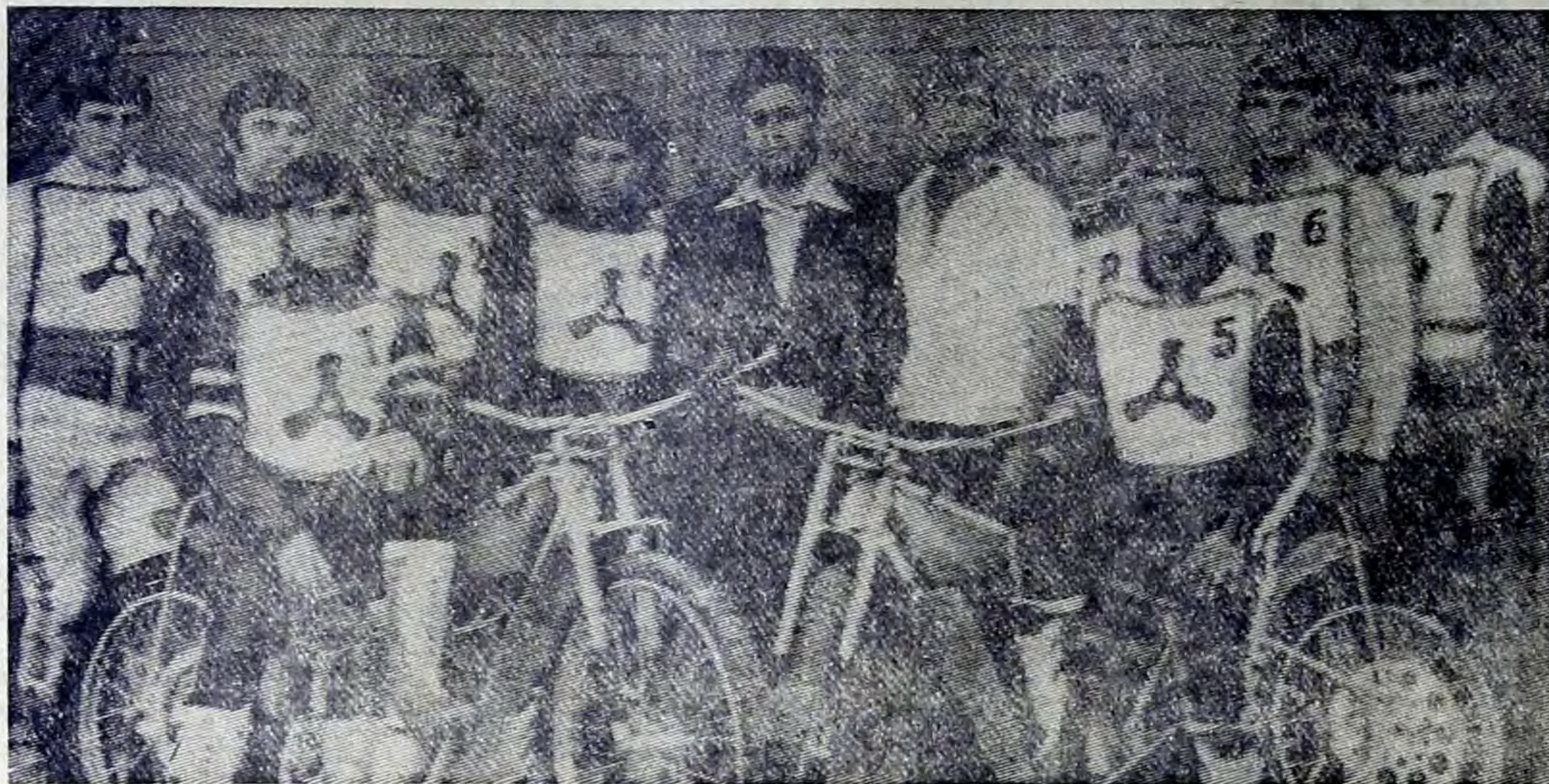
Да, и снова для команды «Турбина» осень оказалась золотой. Балаковские мотогонщики в четвертый раз подряд добились звания чемпионов страны по спидвею среди команд высшей лиги.

Теперь, когда чемпионат закончился, когда все страсти позади, можно подвести некоторые итоги, вспомнить наиболее запомнившиеся своей остротой и трудностью встречи. «Турбина» набрала 38 очков из 40 возможных. Идущая следом за чемпионской командой «Вашкирия» (Уфа) имеет лишь 28 очков, а третий призер — команда «Сибирь» набрала 27 очков. Это говорит скорее о том, что борьба в высшей лиге шла по существу за второе и третье места.