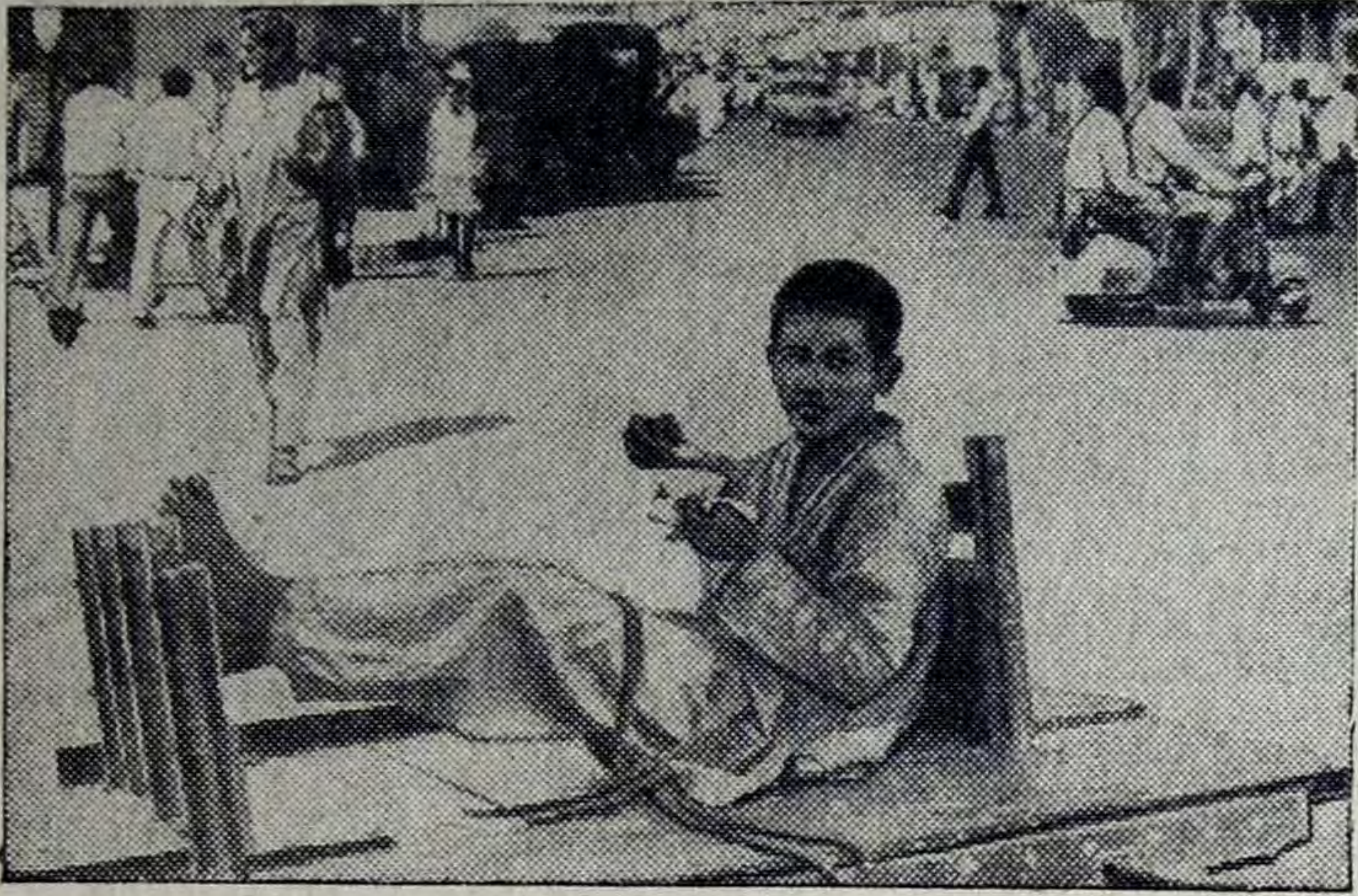
Пакистанские подростки трудятся в мастерских, магазинах, гостиницах, на бензозаправочных станциях. На снимке: обеденный перерыв у маленького возницы в Карачи.