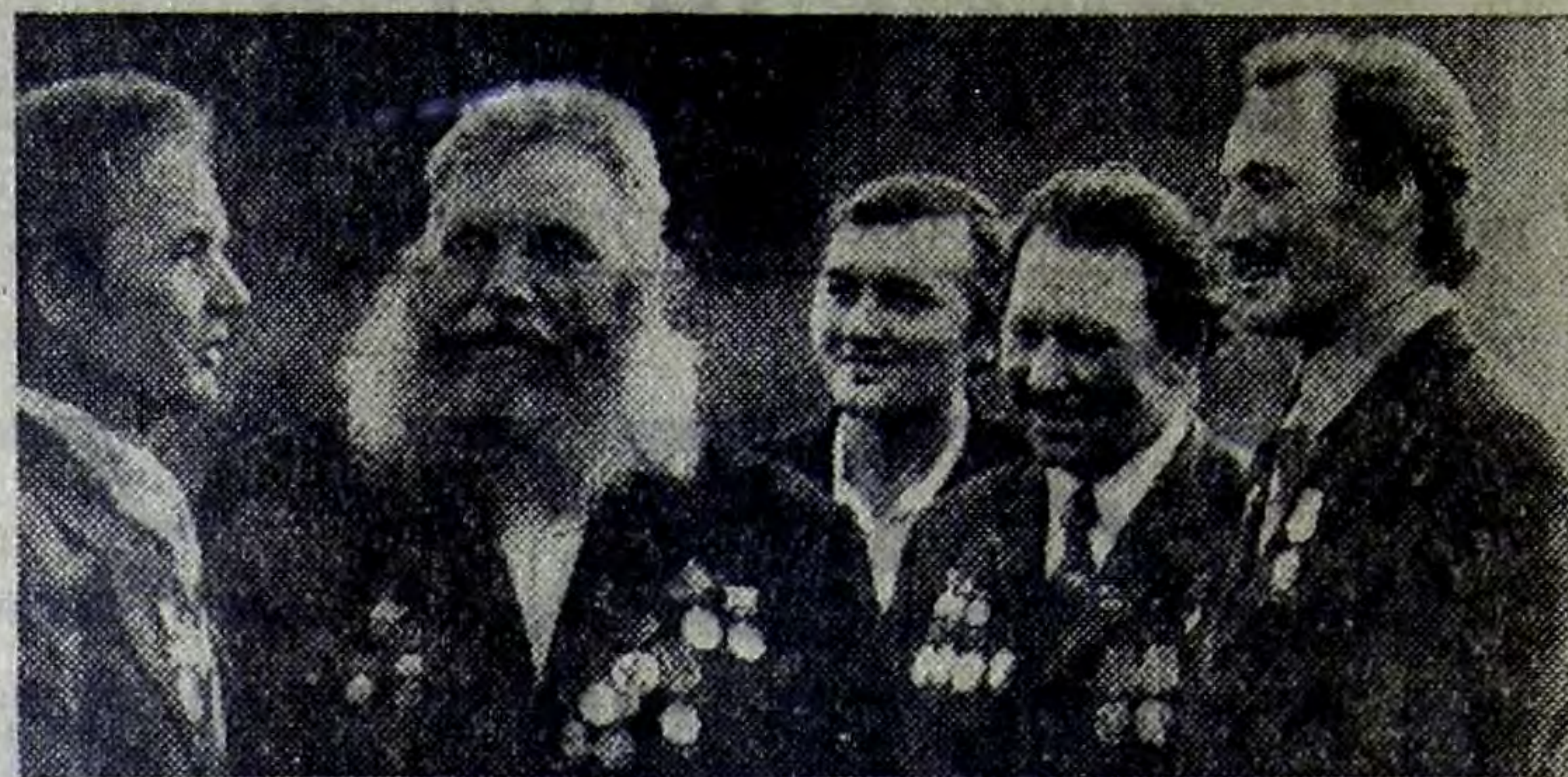
Славен Алтай трудовым героизмом людей. В крае — десятки знатных рабочих династий, известных на всю страну. Среди них — семья мараловодов Поповых из далекого горного села Карагай (Горно-Алтайская автономная область).

Н. ЛЯПИН, секретарь парткома колхоза им. Свердлова.