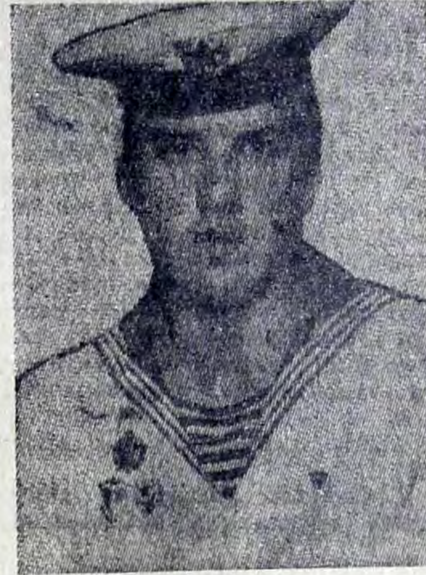
доверено быть старшим боевого поста.