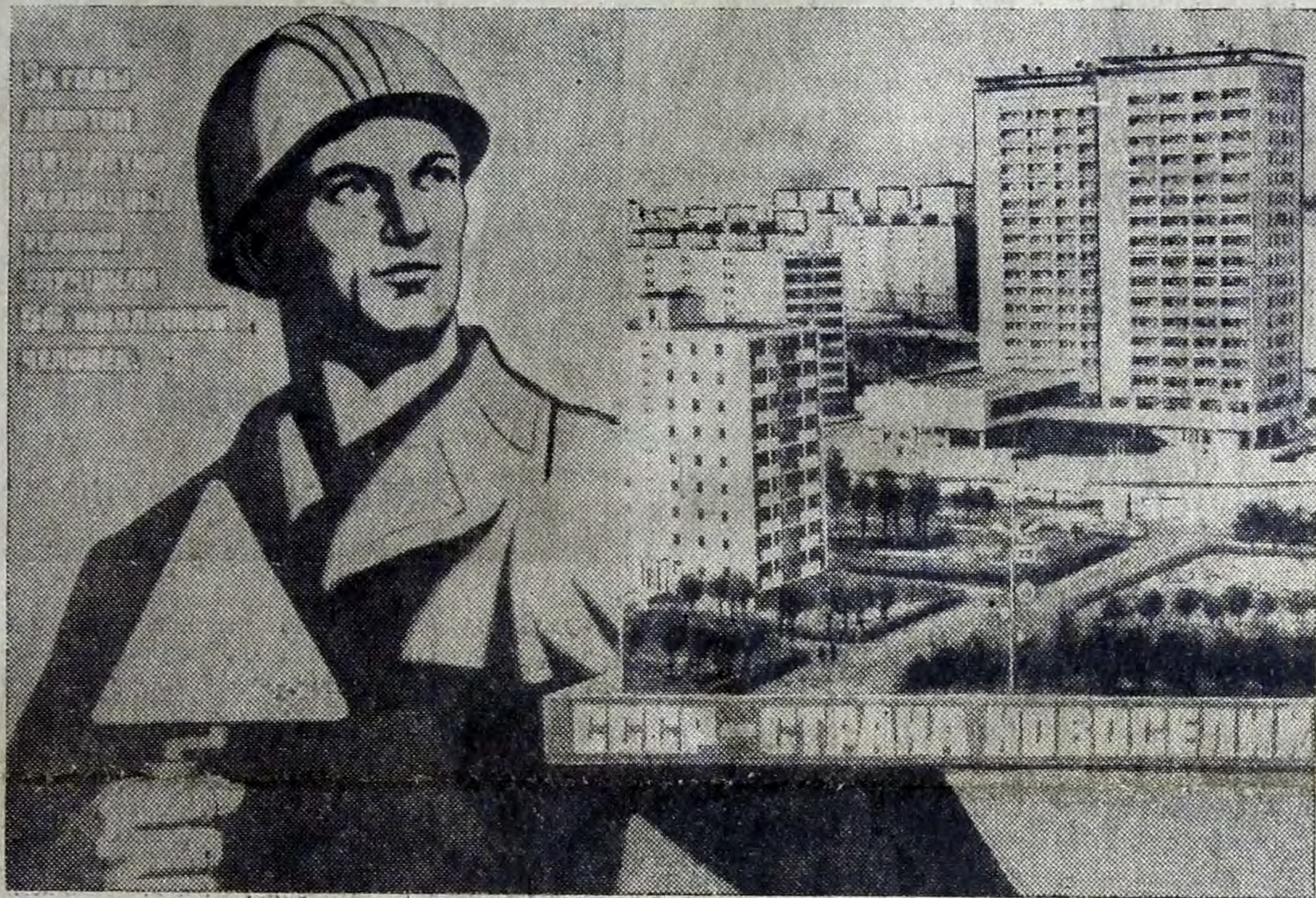
Плакат художника Л. Голованова к Дню строителя. Издательство «Плакат».