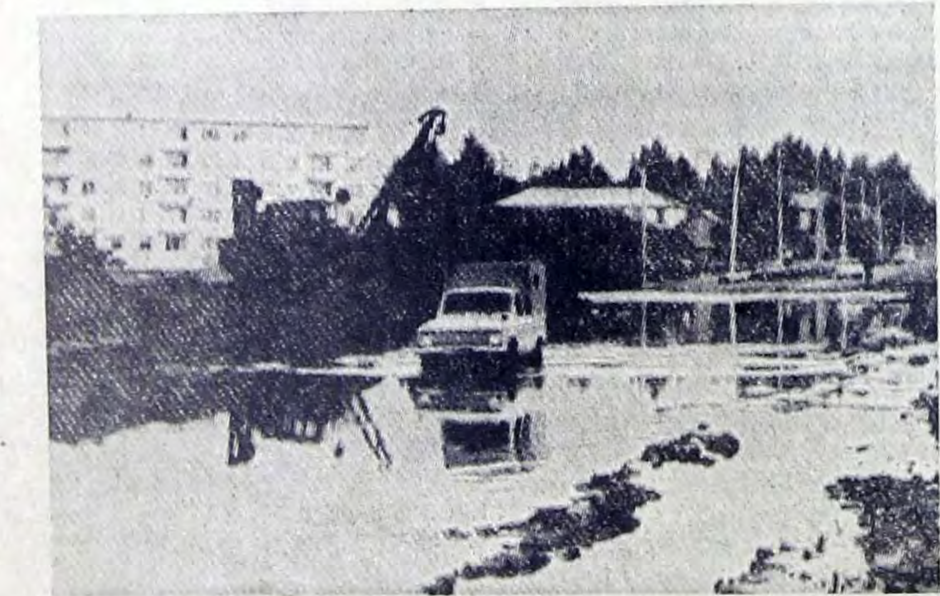
Редактор В. Д. ДЕЛАШИНСКИЙ

в ЖКУ производственного объединения «Химволокно» слесаря по ремонту оборудования по 5 р. в парк, рабочих по уборке аттракционов в парк, дворников в парк, слесарей-сантехников, газослесарей-сантехников, слесарей бойлерных установок, плотников, маляров, дворников в домоуправления, слесаря по ремонту оборудования в мастерские, слесаря-моториста по ремонту ДВС, автослесарей, компрессорщиков, шоферов, трактористов на Т-40, экскаваторщиков. 3—2.