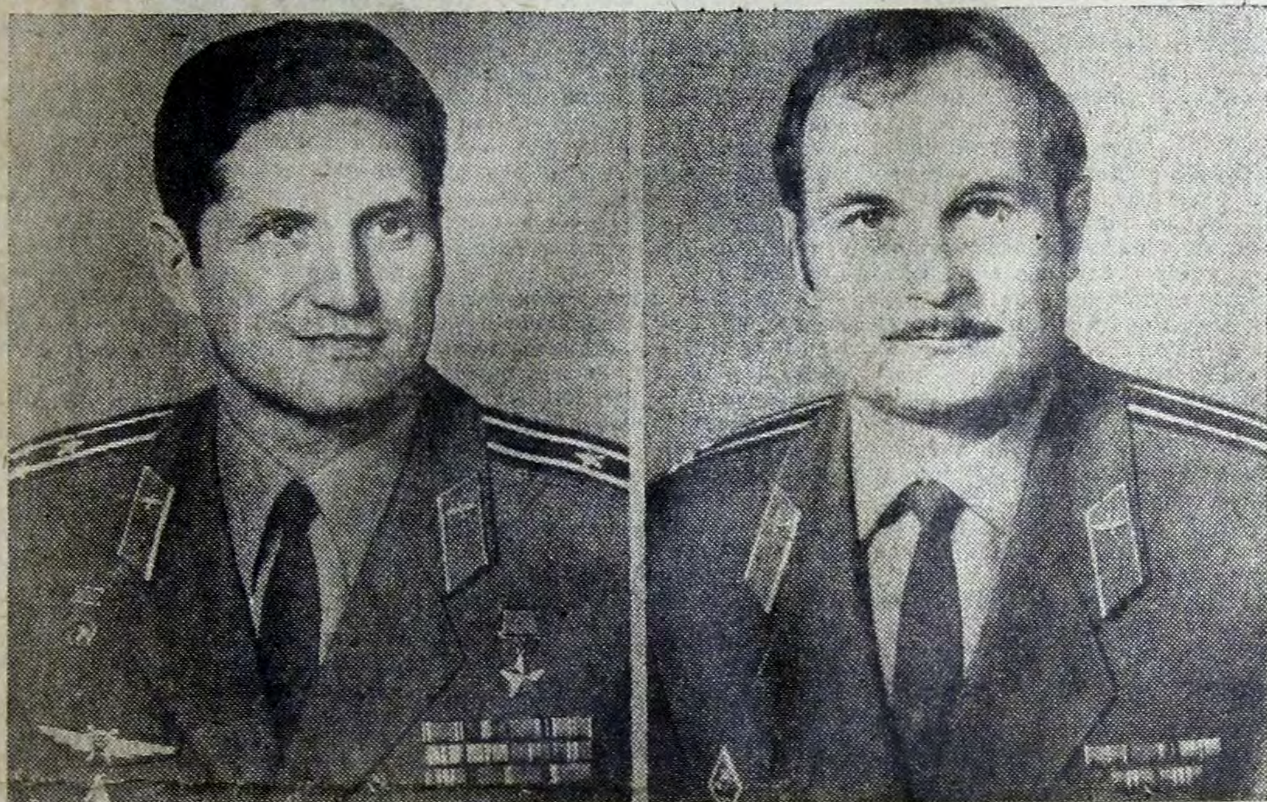
Командир экипажа космического корабля «Союз-21» летчик-космонавт СССР, Герой Советского Союза, полковник Борис Валентинович Волюнов.

№ 111 (8199) ♦ Вторник, 13 июля 1976 года ♦ Год издания 59-й ♦ Цена 2 коп.