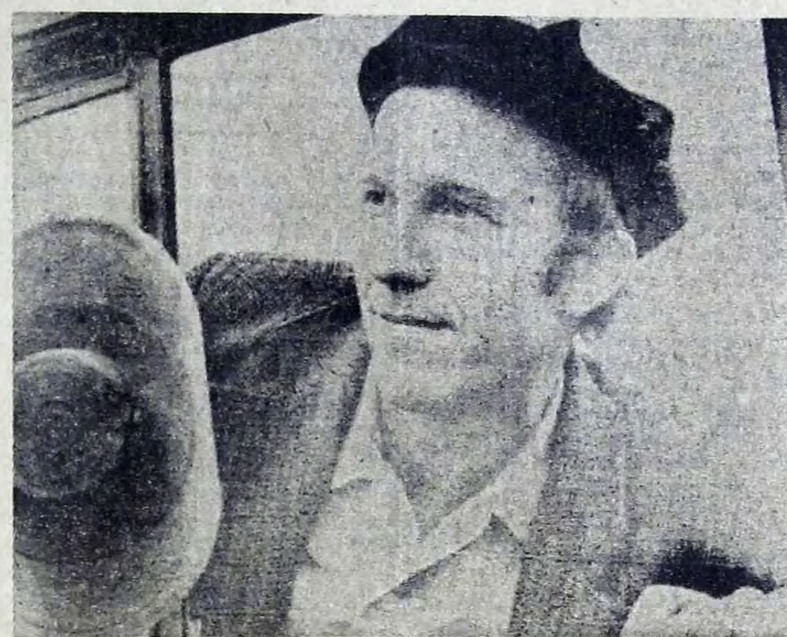
ОНИ ИДУТ ВПЕРЕДИ

Пусть же на каждой стройке партийная организация станет подлинным вожаком масс в борьбе за осуществление политики партии, больших задач пятилетки.