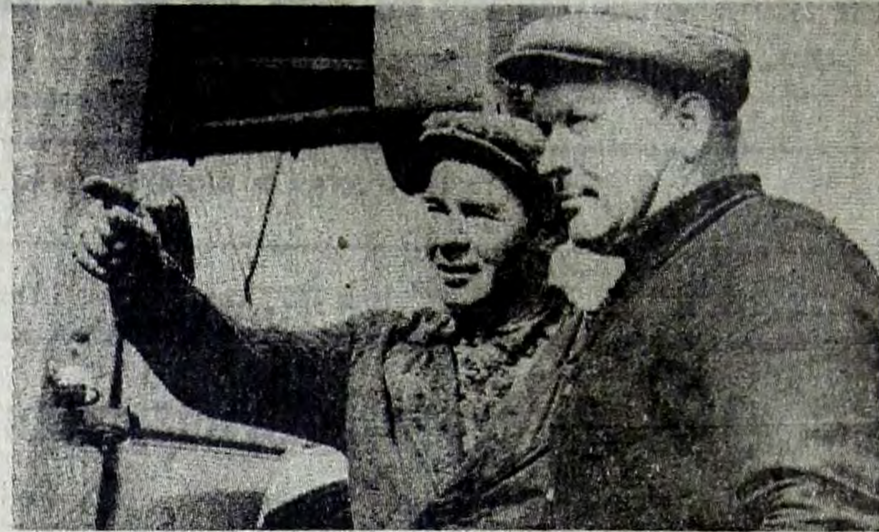
Высокого качества работы по подготовке хлебоуборочных механизмов добились механизаторы колхоза «Заветы Ильича».

По обсужденному вопросу собрание приняло соответствующее решение.