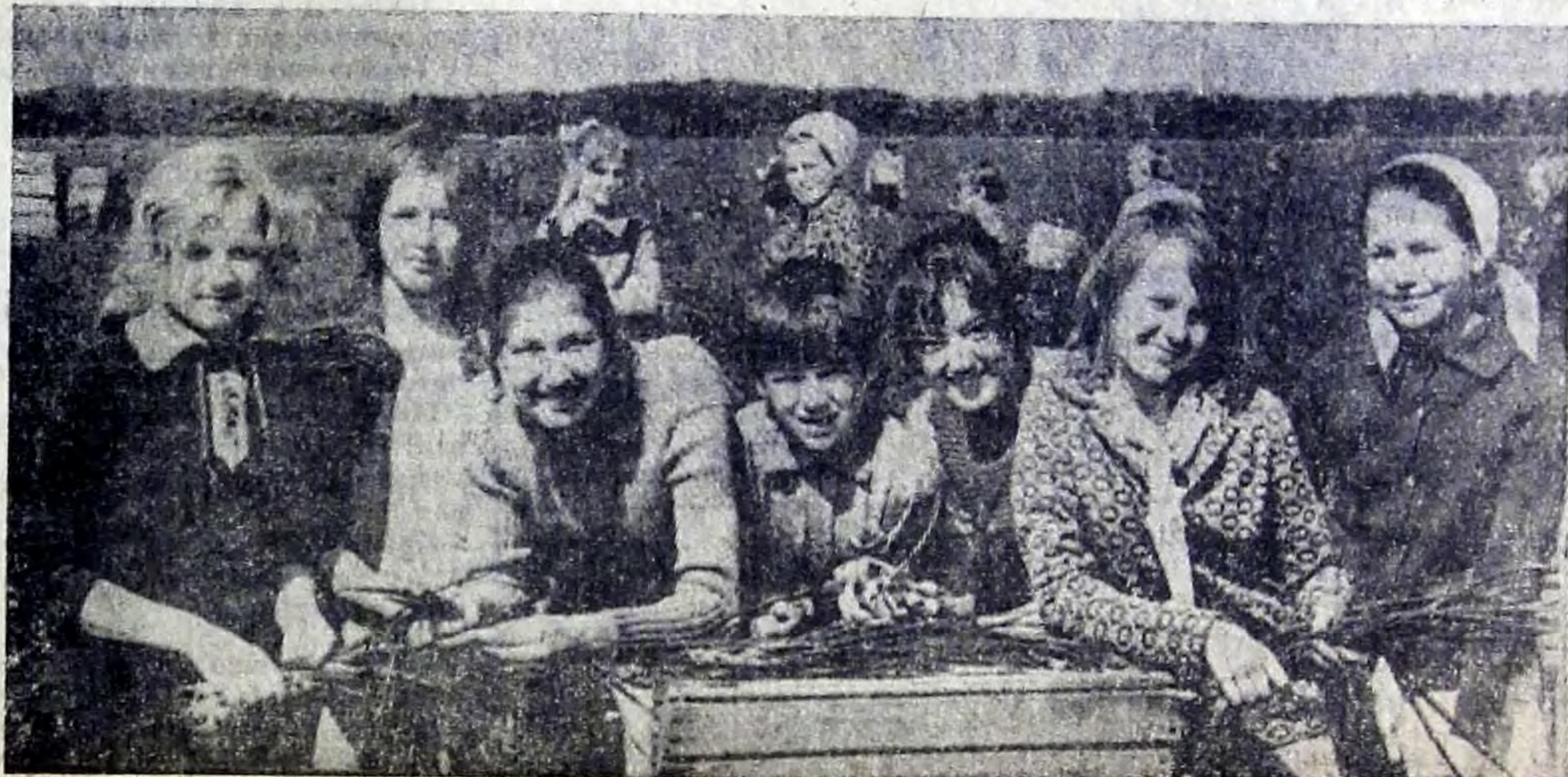
В отделении № 2 совхоза «Волгарь» активное участие в уборке ранних овощей принимают учащиеся школ.