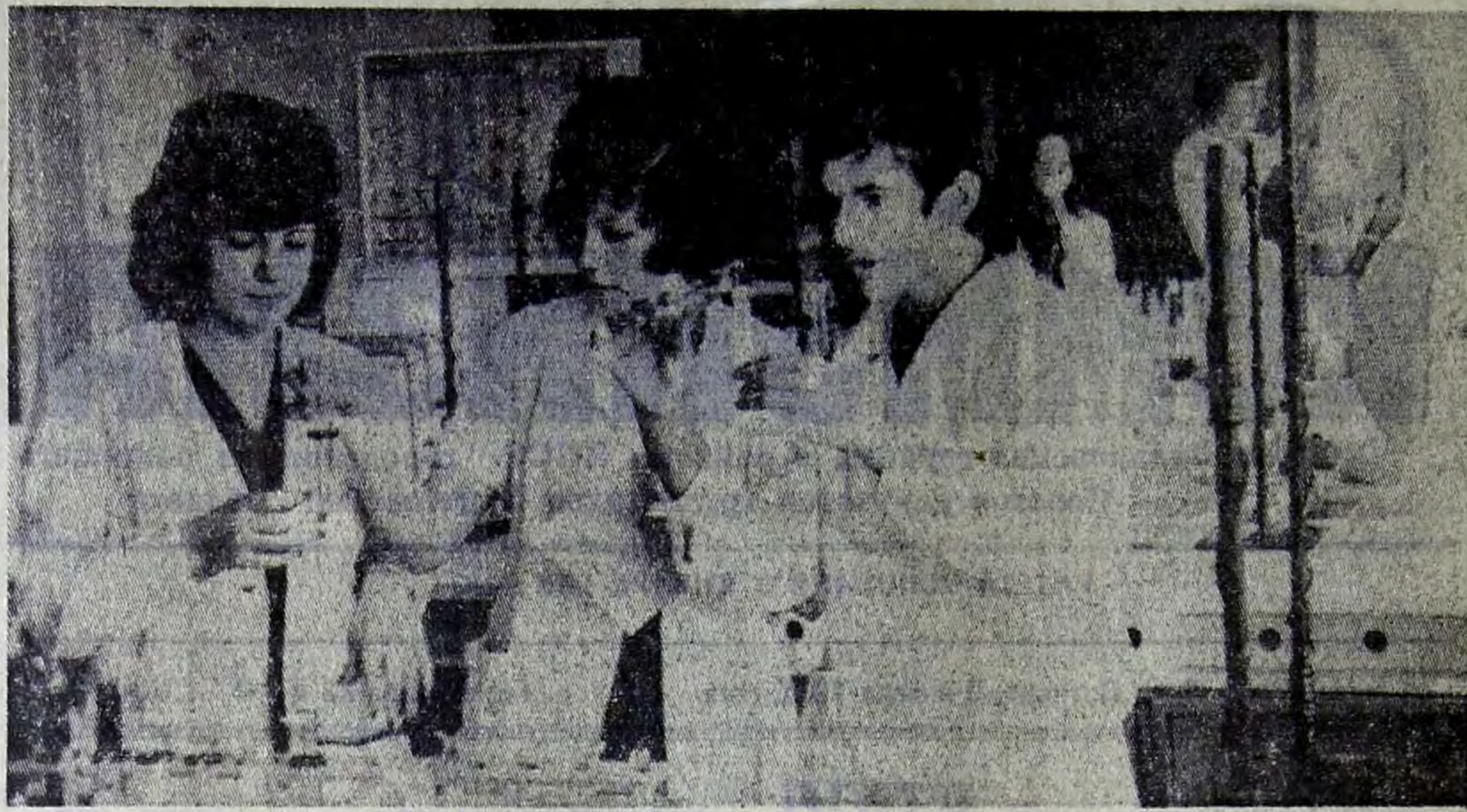
Филиал политехнического института: идут занятия в лаборатории общей химии, цель которых закрепить на практике полученные на лекциях теоретические основы курса общей химии.

Активное участие принимают студенты и в работе научного химического кружка.