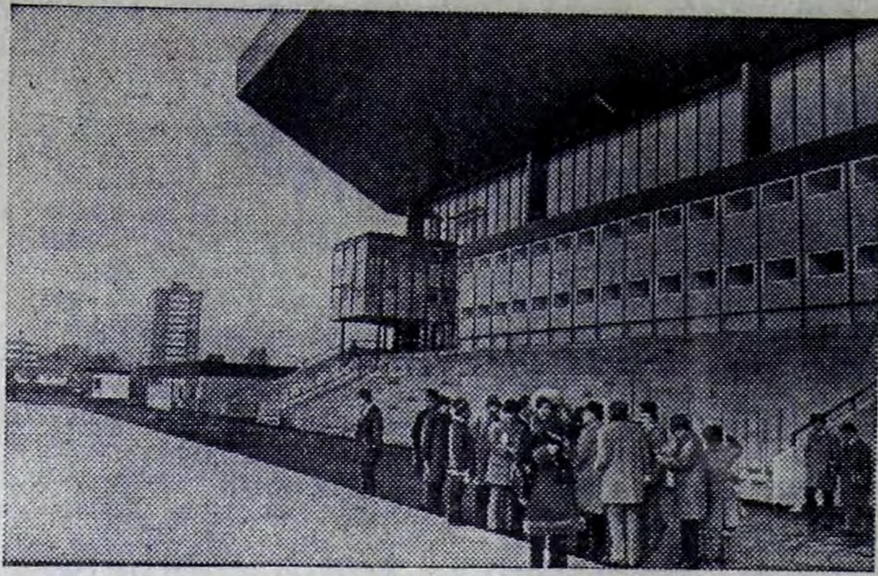
Австрийский город Инсбрук готовится принять участников и гостей зимних Олимпийских игр 1976 года. Опыт проведения здесь Олимпиады 1964 года помогает устроителям основательно подготовиться к встрече спортсменов. Столица Тироля пополнилась новыми сооружениями, а существовавшие ранее — модернизируются.