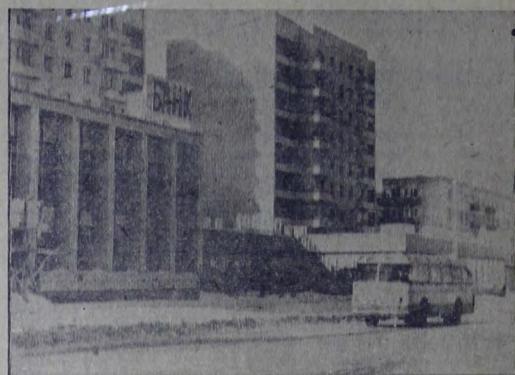
Неузнаваемо меняется облик улицы им. Ленина. Новые жилые комплексы и административные здания один за другим вырастают на главной улице города. На снимке: на одном из участков улицы им. Ленина.