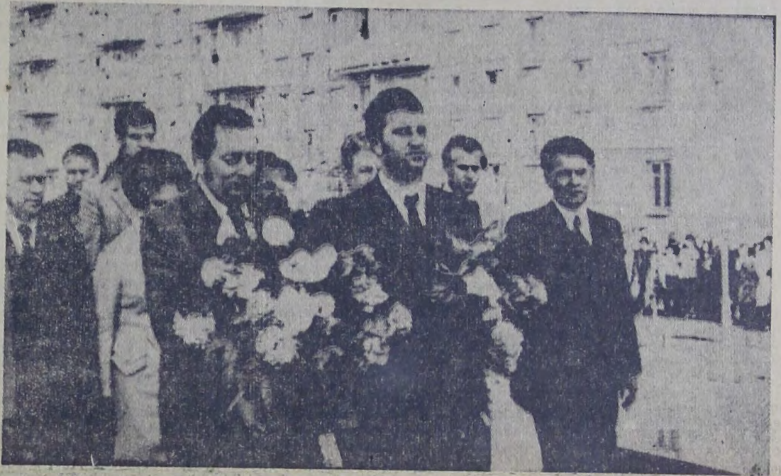
На снимке: возложение венков к обелиску балаковцам, погибшим в годы Великой Отечественной войны.

На центральной площади города состоялся митинг советско-чехословацкой дружбы.