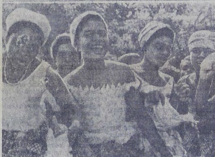
Тоголезская Республика, расположенная на берегу гвинейского залива, скоро отметит 15-ю годовщину своей независимости. За этот период двухмиллионный народ страны добился успехов в развитии национальной экономики и культуры.