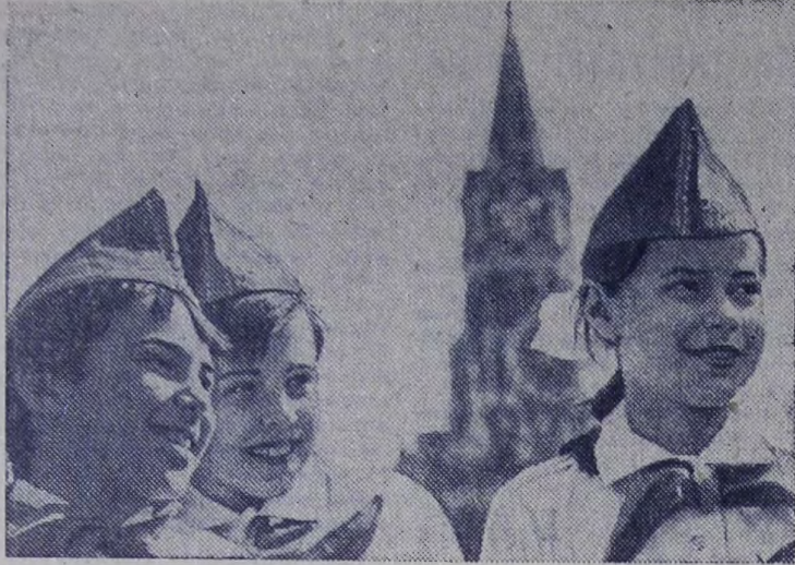
19 мая — день рождения пионерской организации. В этот звонкогослый праздник советской детворы, по всей стране поют горны, на Всесоюзной линейке ребята рапортуют отличия о своих славных делах. По традиции весной октябят принимают в ряды юных ленинцев.