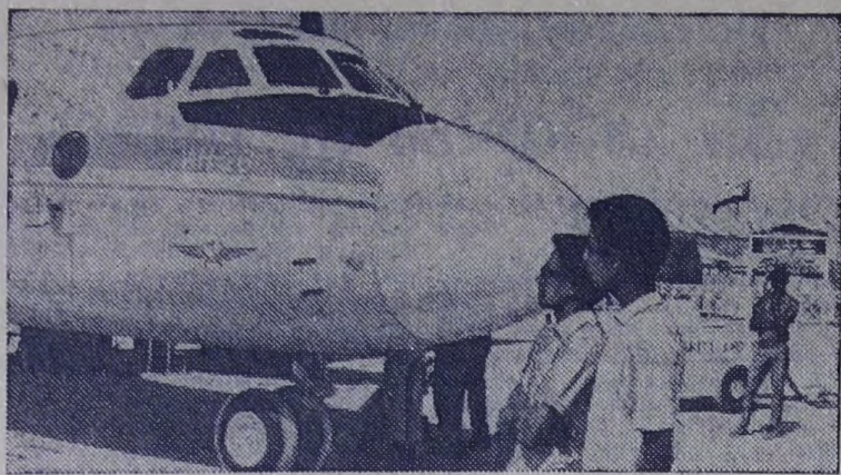
Демонстрационные полеты советского грузового самолета «АН-26» были организованы в ряде стран Африки.

Суданцы одними из первых получили возможность ознакомиться с самолетом. Суданские официальные лица, представители заинтересованных фирм и компаний дали высокую оценку летно-техническим данным «АН-26».