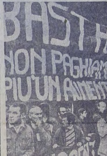
Мощные манифестации протеста против непрекращающейся дороговизны проходят по всей Италии. Трудящиеся требуют обуздать стремительный рост цен, остановить инфляцию, обеспечить занятость.