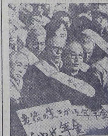
Политика наращивания высоких темпов экономического роста обернулась для Японии глубокой депрессией, охватившей все отрасли деловой и хозяйственной жизни страны. С каждым днем увеличивается армия безработных, которая превысила один миллион человек, сокращается производство. В стране усиливается борьба трудящихся за свои жизненные права.