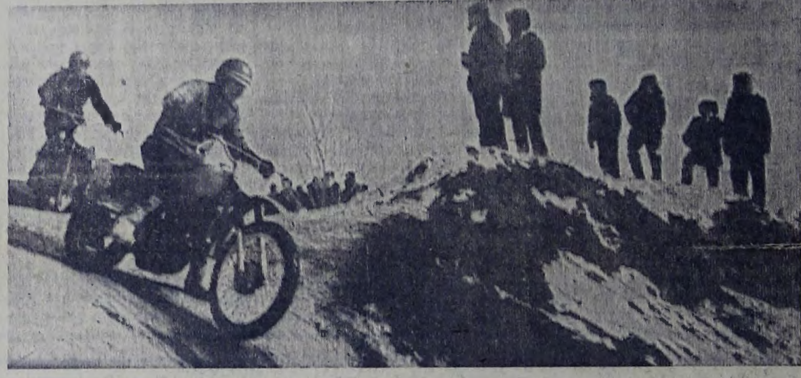
На трассе мотокросса.

Предлагаем читателям песню о нашем городе