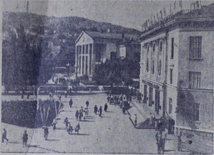
Площадь имени В. И. Ленина.