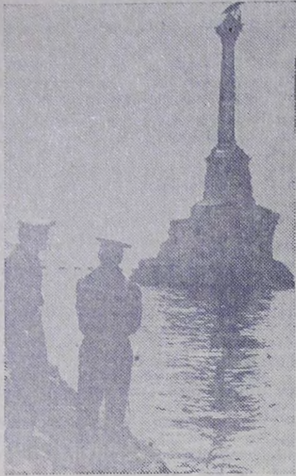
Памятник затонувшим кораблям.