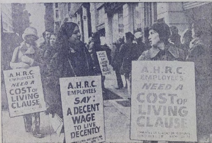
В Соединенных Штатах учителя продолжают борьбу за повышение заработной платы и улучшение условий труда. Вслед за преподавателями города Колумбуса объявили забастовку учителя Гринвилла. Покинули свои рабочие места преподаватели и воспитатели 15 школ Нью-Йорка. На снимке: пикет бастующих учителей Нью-Йорка.