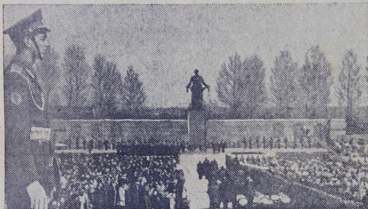
На Пискаревском мемориальном кладбище.