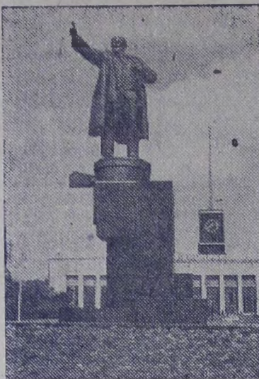
Памятник В. И. Ленину у Финляндского вокзала.